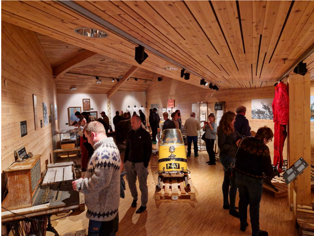
Fra åpningen av utstillingen På pall!