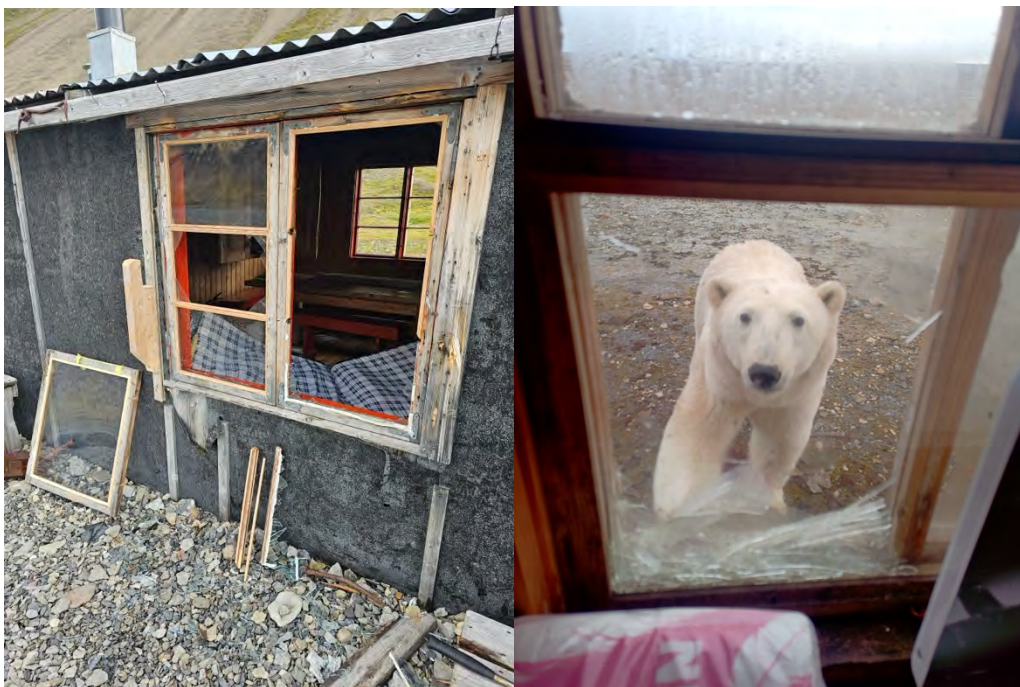
Mye av vedlikeholdsarbeidet på bygningene utenfor bosetningene skyldes besøk av isbjørn, til venstre hytta i Skansebukta.

Kompetansesenter for kulturmiljø på Svalbard skal ha fokus på bygningsvern, men vil også kunne romme andre oppdrag og rådgivning knyttet til spørsmål om kulturminner og bevaring. Senteret skal sikre at kunnskap og kompetanse om Svalbards kulturminner utvikles, forvaltes og forblir på øygruppa gjennom kontinuitet og erfaringsoverføring. Ressurssentret vil være en varig samarbeidspartner og kunnskapsleverandør for forvaltningen av kulturminner og eiere av fredete og verneverdige bygg på Svalbard.