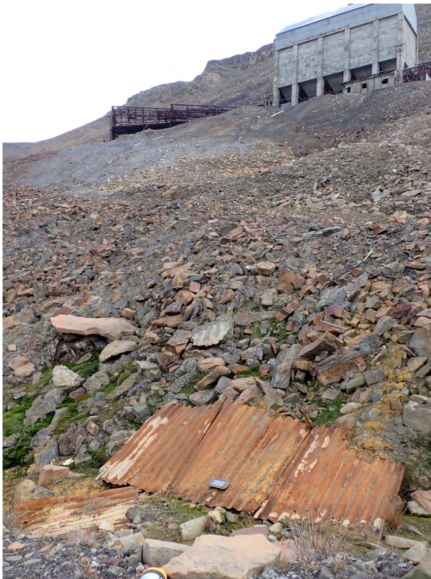
I 2024 ble det gjennomført et prosjekt for å rydde rundt daganleggene ved gruve 5 og 6 i Longyearbyen. Her fra gruve 5.