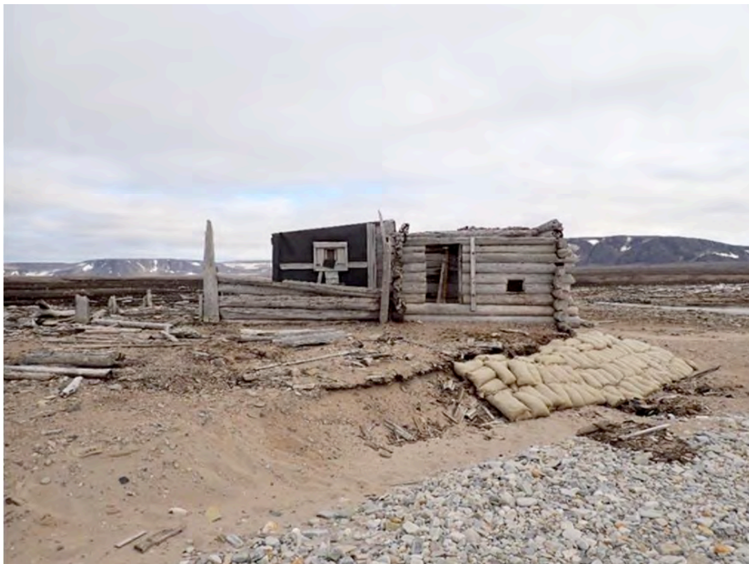
Fangsthytta i Rekvika før utgraving og fjerning.