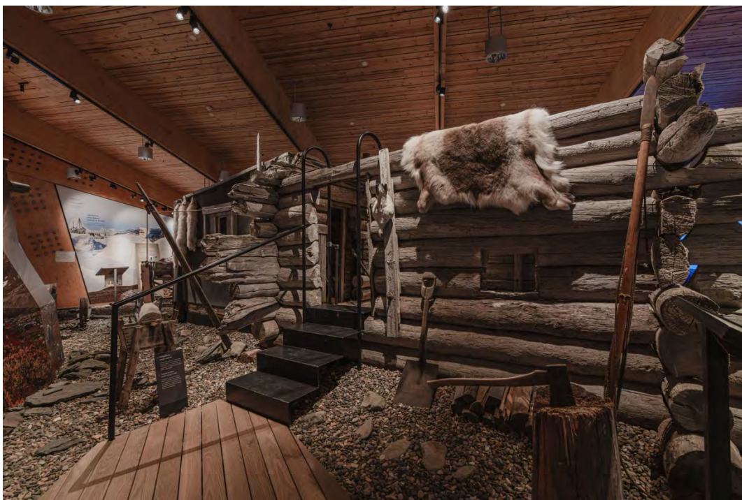
Fangsthytta fra Rekvika montert i utstilling på Svalbard museum i ny utstilling åpnet februar 2024.