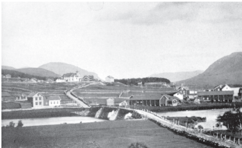
Utsikt fra Grimshaugen mot Steien. Foto: Amalie Skavang. Bygdefolkets eige fotoalbum.