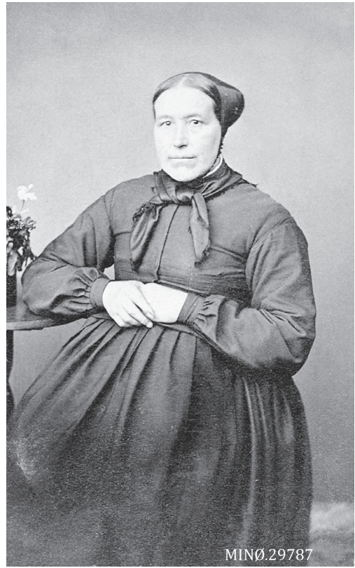
Portrett av kvinne. Gisen som var barnepike hos Tangen på Tønset. Foto: Elen Schomragh. Nordøsterdalsmuseet 29787.