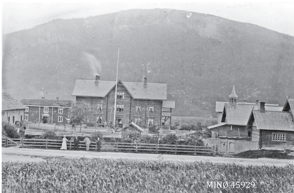
Gamle Steien hotell. Foto: Amalie Skavang. Nordøsterdalsmuseet 45929.