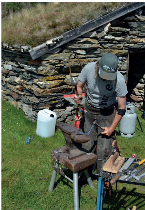
Smed i arbeid, her fra Follidal bygdetun, Uppigard Streitlien i 2016. Yrkesbetegnelsen smed er grunnlaget for Europas vanligste etternavn: Smith, Schmid osv., alt etter språket.

Noe anna som også har vært opphav til dannelsen av tilnavn, er yrkesbetegnelser. Dette gjelder i særdeleshet i tysk, men også andre germanske språk, og i flere andre. Dette er derfor den vanligste etternavnstypen, ikke minst i Europa. I Tyskland er Møller det mest utbredte etternavnet, men i hele Europa er det aller vanligste etternavnet smed: Schmid, Smith, osv., alt etter språket. Vi ser altså at dette meget respekterte håndverket i det gamle samfunnet er opprinnelsen til det som er det vanligste etternavnet.