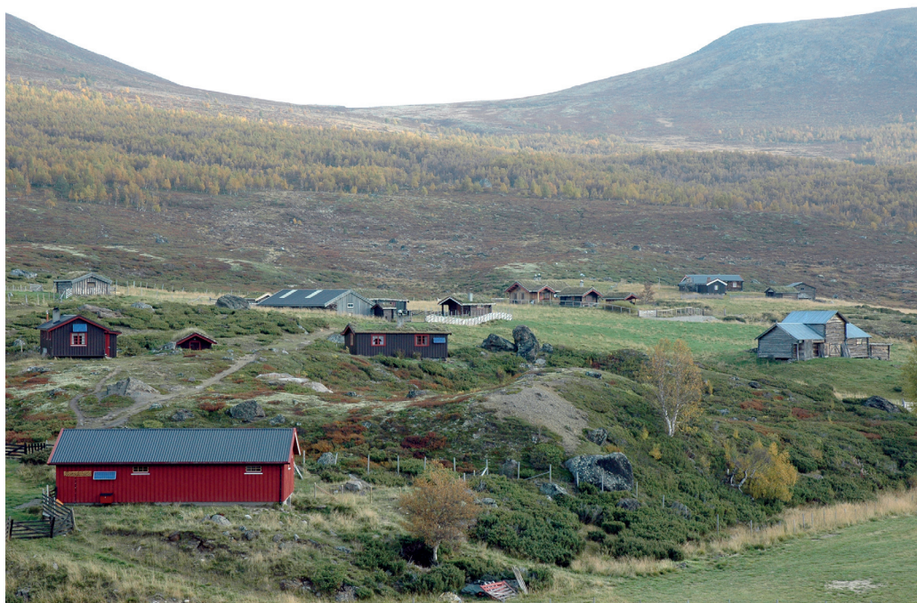
Romsdalsætra i Einunndalen. Her bodde familien Romsdal periodevis hele året. Romsdal er et eksempel på gruvefolk som fikk et tilnavn danna av opphavsstedet deres, som vart sterkt knytta til familien og som med tida gikk over til å bli fast etternavn.

antall i Alta og spredd ut derfra att. Så Romsdal kan vi si er et eksempel på «etternavn på vandring».