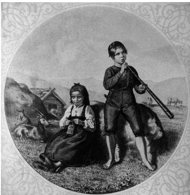
Gjeterlivet sett i nasjonalromantikkens lys – «Børnene paa Sæteren». Adolph Tidemand. GMF.20913