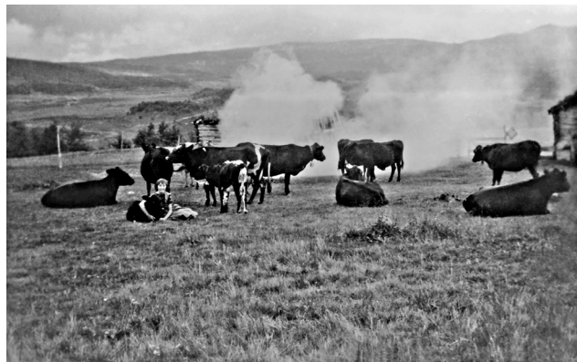
Rauke på Oustvollen i Kløftåsen, Os. 1925. Det ble lagt torv på bålet for å få mye røyk. MINØ.047622

Streitlien (1978) skriver om nattkveer for sauene: «Somme stader var det ei laus kutrø som en fløtte rundt på vangen. Til