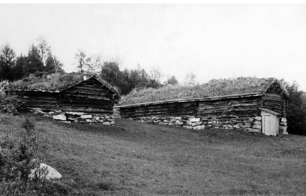
På noen setervoller var det egne sauefjøs. Her på Liavollen i Tolga. 1942.

Gjeteren førte buskapen ut i beitemarka, og tilbake til setra om kvelden. I tider med