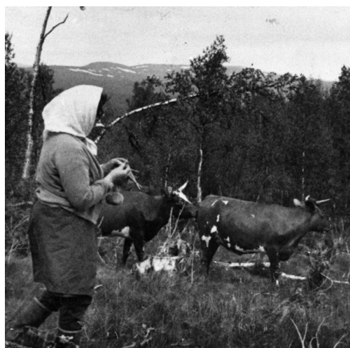
Kirsti Engset sammen med kyrne i beitemarka i Vingelen. VMT.52603