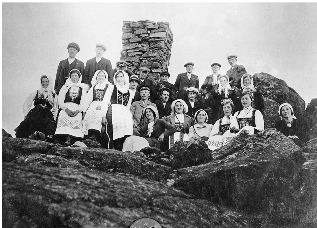
Ungdomslaget Uredd fra Tyllaldalen på toppen av Tron 17. mai 1914. MINØ 21338

Vi har tatt et lite dykk i vårt rikholdige billedarkiv og funnet fram en del interessante bilder. Det er ikke så mange bildene vi har, men vi har funnet noen bilder som viser feiringen 17. mai 1914 i Folldal, Lilleelvdalen, Tyllaldalen og Tolga.