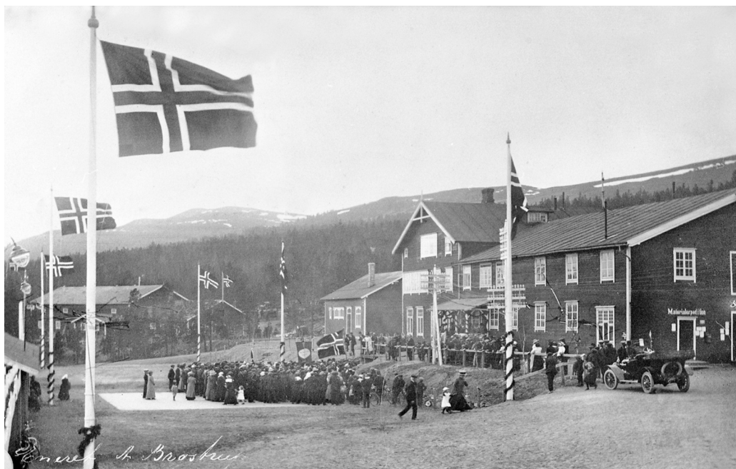
Jubileumsåret 1914. Folk samlet på Folldal Verk. MINØ 25997