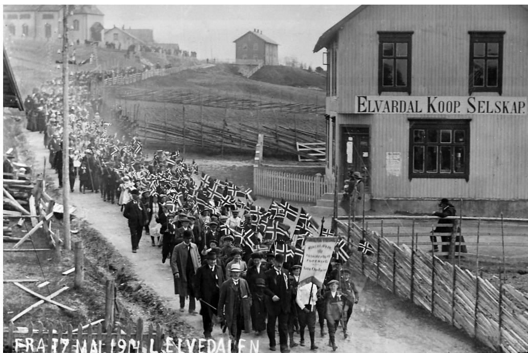
17. maitoget i Lilleelvdalen 1914. Elvardal kooperative selskap til høyre. MINØ 22501