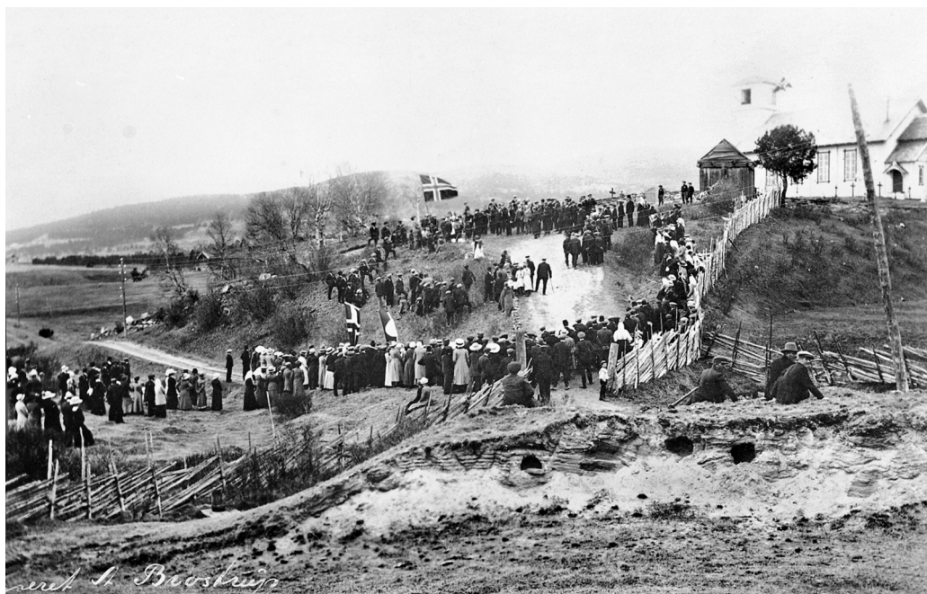
Axel R. Brostrup Jubileumsåret 1914 – 17. mai. Bondebryllupet og kyrkjelyden samlet på kirkebakken. Fotograf: Axel R. Brostrup. MINØ 26000