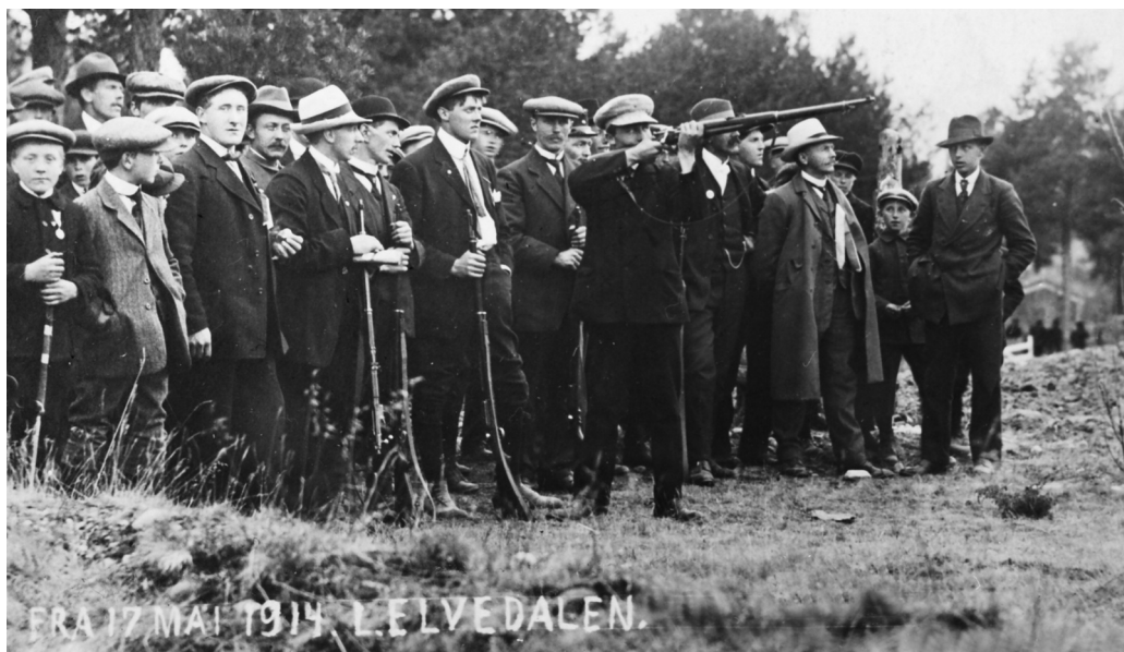
Skyttere i Lillelvdalen 17. mai 1914. MINØ 45916