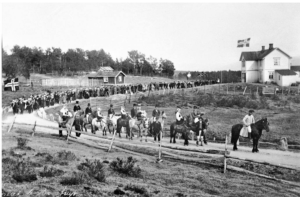
Axel R. Brostrup Bondebryllupfølget på veg til Folldal Verk. Bildet er tatt i Solheimsvingen. Fotograf: Axel R. Brostrup. MINØ 25999