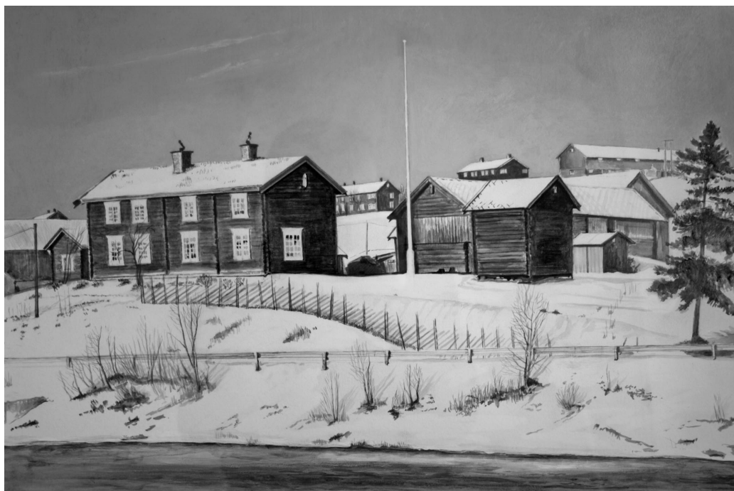
Oslata østre.

I Om Bygnings-Skikken på Landet i Norge utgitt i 1862 skriver Eilert Sundt i kapitlet Dalsbygden: