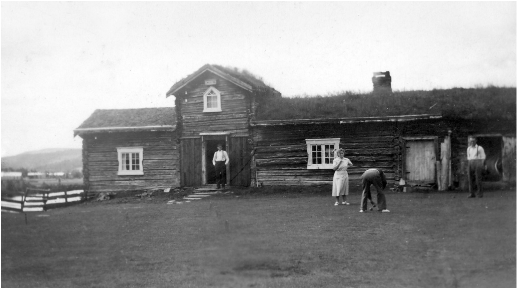
Sommerstua på Osflata. Fra venstre: 'litjstuggu', gangen med kvistloftet over, eldhuset, kopphuset, vedskjælet. Krokett har lange tradisjoner på Osflata.

Vi hadde berre 5 – 6 mjølkky'. Det va' itte så stort hell', gammelfjøset. Dyra sto bøtten åt veggå, og vi fôra ti båsom. Je' va' mye med i fjôsa, og je' va' sæterkulle i sæter'n i Anvisåsa nørr je' vart gammal nok. Der mjølka vi med haain, fôrr vi hadde itte maskin. Vi vaska bøtter og spann uta sæterdøren, kjæm je' på, og hengte dom te' tork på veggå. Fôr separerte 'om, og kinna og ysta. På b'ynnelsen tå søttitala vart det slut med sætringen heme på Flaten. A mamma dødde i toogsøtti, og da va' det ingen som kunn' ligge på sætern med kryttyrom lenger.