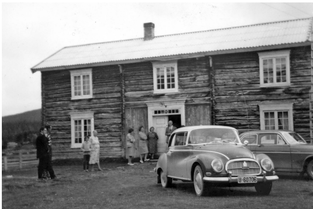
Vinterstua på Osflata.

ble bebygd. En mener at den første stuebygningen var ei østerdalsstue som de første brukerne fikk med seg fra Ustu. Dette huset ble sannsynligvis ombygd og ble en del av hovedbygningen som fortsatt står på garden.