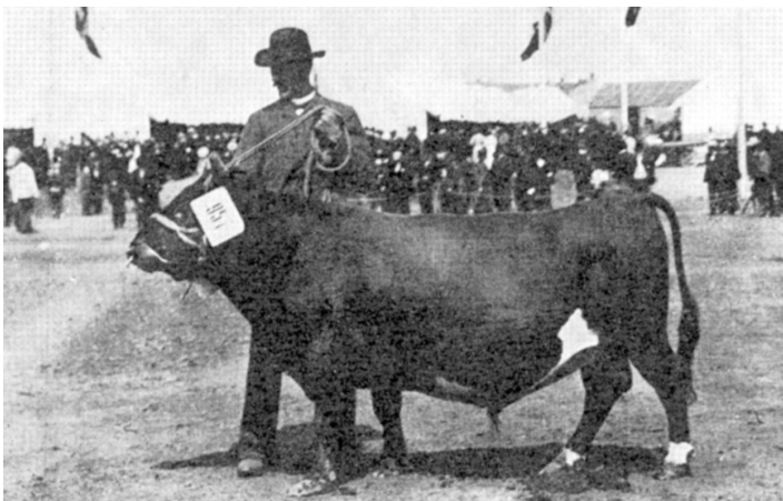
Dølen på toppen av sin "karrière". Her på landsutstillinga i Kristiania i 1907 hvor den fikk første premie og ekstrapremie for fremragende avkom.