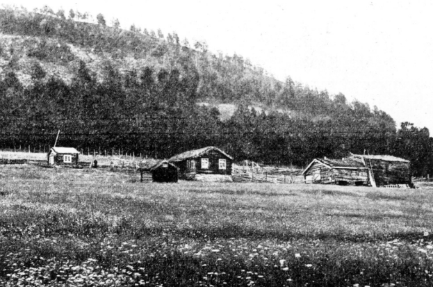
Dalen, Nystuen søndre (110011). Kopi etter Ivar Sæter: Foldalen. Repro: Musea i Nord-Østerdalen.

I husdyravlen blir nevninga matador brukt om hanndyr med særlig stor innvirkning i avlen. I dølfæavlen er Dølen matadoren framfor noen. Oksen ble født i 1894, og gjennom sitt 16-årige liv kom den til å gjøre en "glimrende karriere". Den kan langt på vei sies å være stamfaren for østerdalsfeet.