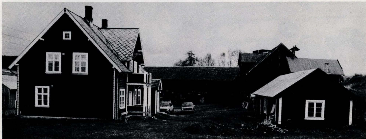
Museumssenteret på Ramsmoen, Tynset med kontor, mørkerom, verksted, utstillingslokale i fjøset, arkiv i møkkjelleren og gjenstandsmagasin på stabburet.