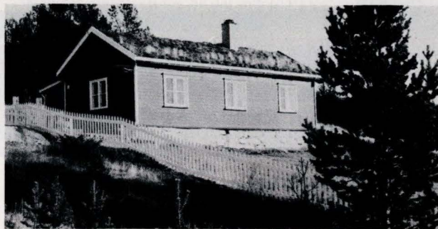
Fra Follidal Verk, Follidal. Brakke fra ca. 1910.

Det er journalført 250 utgående brev, mens det har kommet inn 496 sendinger.