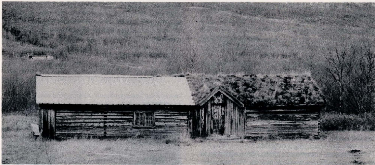
Seterstue Iselvdalen, Målselv, vernet. Når skal Nord-Østerdalen få sitt første vernede seteranlegg?