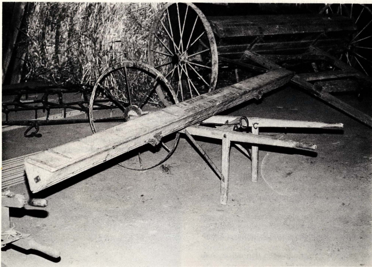
Såmaskin, for det meste nytta til grasfrø, men også til anna slags frø. Breidsåing var vanlig, men de første maskinene var i bruk alt i 1910. Ein modell av typen fekk gullmedalje på jubileumsutstillinga i 1914 under navnet Markens Grøde.

Under opninga av utstillingen vart det lagt opp til hestemønstring.