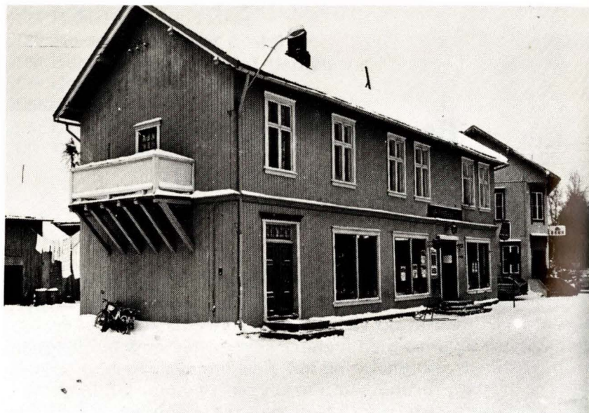
Banken på Os

ranse i Os. Bygdefolket slutter opp om banken. I stor utstrekning kan en si at det som skjer med banken, og det banken foretar seg, angår de aller fleste i kommunen. Når Tolga-Os Sparebank har bestemt at de vil rive den gamle Bankbygningen i Os sentrum, er det en sak som angår alle osinger, på flere måter. Derfor har vi også lov til å si hva vi mener, og forsøke å forandre et vedtak vi mener er forhastet og feil.