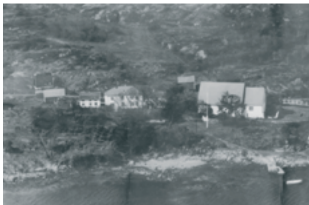
Før brannen i 1963 lå bygningene på Dolm prestegård tett i tett ved veien vest for kirka. Nærmest kirka lå den eldgamle Herrestua, som var tilbygd hovedbygninga fra året 1800. På sidene 17 - 20 finner du en bildemontasje om Dolm.

er et årsskrift som Hitra historielag og Kystmuseet i Sør-Trøndelag gir ut i fellesskap. Det har fått et navn som du kanskje synes er litt underlig. Bakgrunnen er denne: Før i tida var det ganske vanlig rundt om i grendene på Hitra at folk hadde mer eller mindre faste plasser der de samla seg, fortalte historier og løste lokale verdensproblemer. Ofte var det i godværet på søndager eller lørdags ettermiddager at folk kom sammen og hygga seg på denne måten. Tett i tett kunne de sitte utover lyngrabbene, gjerne med god utsikt, i le for austavindstrekken. På Sandstad hadde de en slik samlingsplass som ble kalt Skarvsetta. Namnet kommer trulig av at her satt folk tett som skarven på et skjær. Årsskriftet vårt skal forsøke å videreføre fortellertradisjonen og historiene fra Skarvsetta og fra liknende samlingsplasser rundt om på Hitra. Velkommen til Skarvsetta.