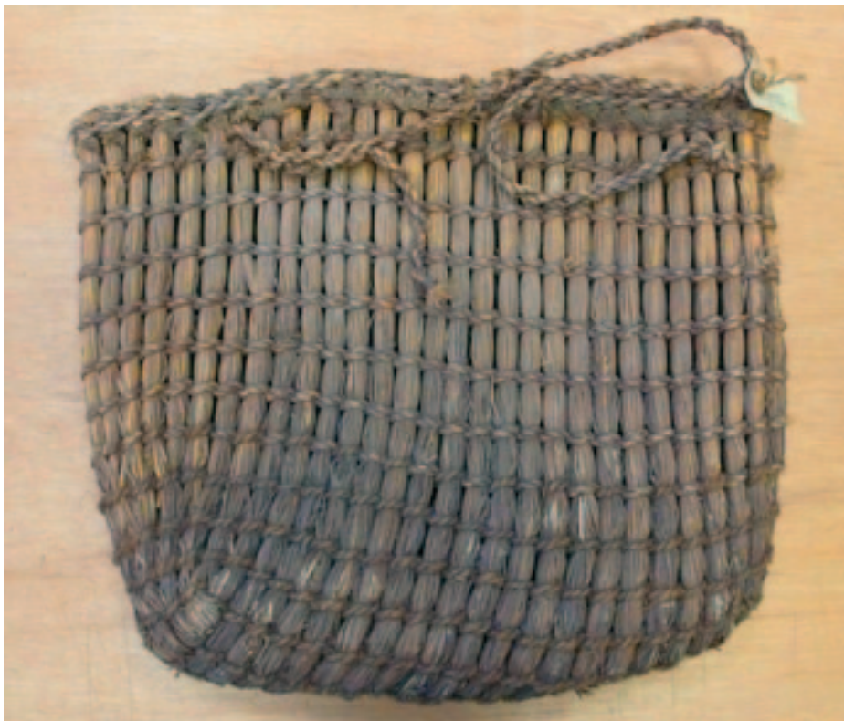
Sjømanns- bødi med oppstendere og flettetau av lyssiv.

Shetlandsøyene er for det meste trebare. Dette har påvirket materialbruken i både byggeskikk og tilvirking av husgeråd. Mens folk i Norge har anvendt trevirke, har shetlendingene måttet ta til takke med halm fra den gamle shetlandske havren, høymole og lyssiv i tilvirking av bærekurver. Det er i beskrivelsen av bærekurver brukt hos våre naboer i vest at det norrøne ordet net (flettverk av snorer og tråder) virkelig kommer til sin rett. Kurvene heter kessi eller bødi og består av staver i ulike materialer