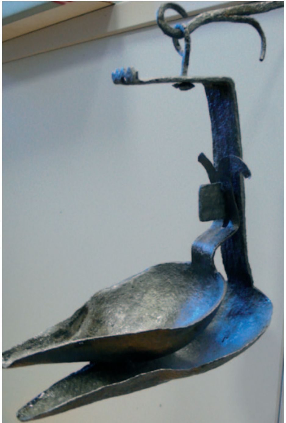
Kola (tranlampe) på Shetland.