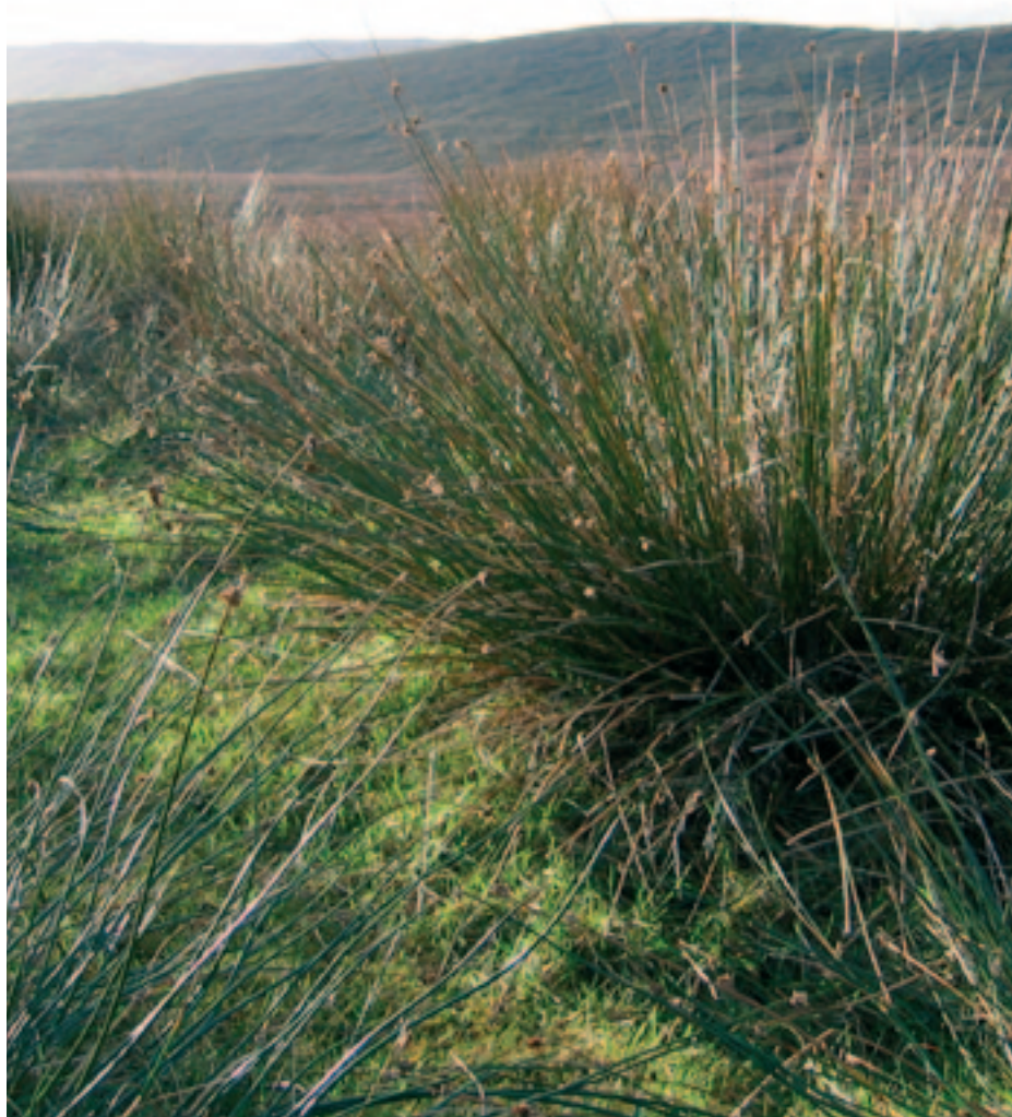
Lyssiv Juncus effusus på Shetland.

På begynnelsen av 1990-tallet foretok jeg flere reiser til Shetlandsøyene for å intervju eldre mennesker om levevilkår og naturalhusholdning. Mange av dem jeg snakket med var født rundt 1900. De fortalte i detalj om innhøsting og tilvirkning av ulike materialer til mange slags husgeråd. Noen av de mest omfattende beretninger handlet om kurvmaking.