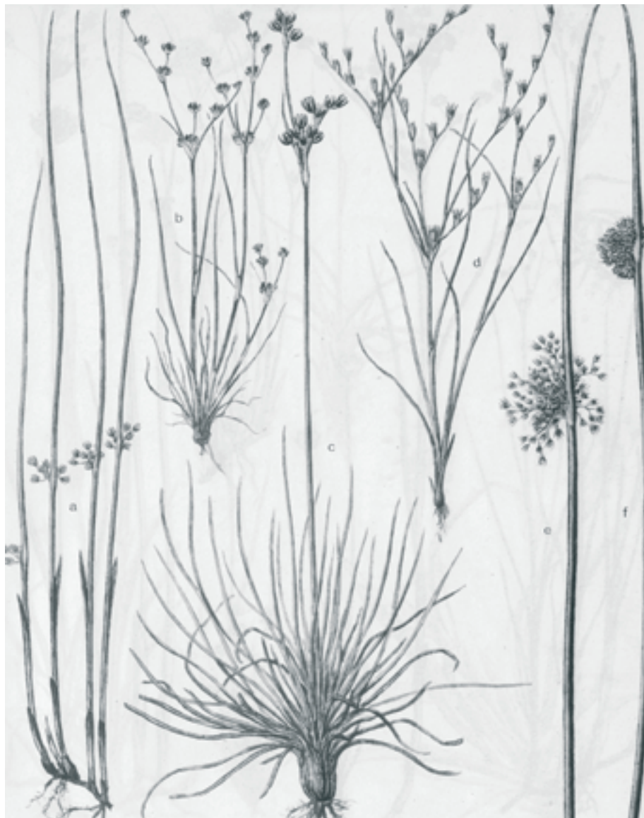
Forskjellige arter av siv Juncus spp. Etter Fægri (1970), Norges Planter , Bind III, plansje 16.

På Hjelmeland i Ryfylke ble sivaks hentet fra vann på Jæren og brukt til fletting av setene i Jærstolene. Om det har vært brukt som nyttevekst på Hitra og Frøya har jeg ikke opplysning om. Hvis noen av Skarvsettas lesere har kjennskap til bruken av siv i Trøndelag, ta vennligst kontakt.