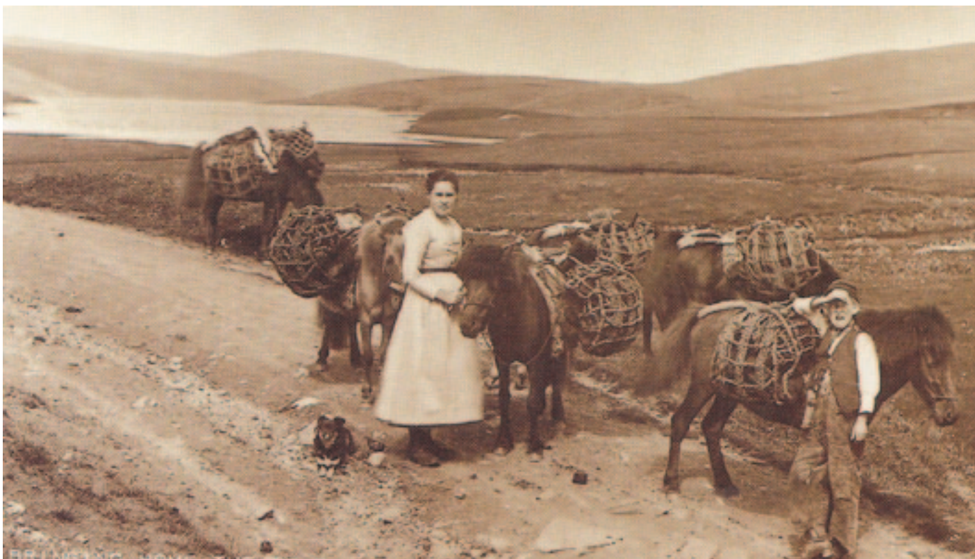
Sikringsnett over hestelast på Unst.

året, forstår vi bedre Joanns nøkterne kommentar om å dra opp sivet for å få det "litt lengre". Kurvmaking, og det å tvinne simmens for hånd, var manns arbeide om vinterkveldene. Kvinnene var opptatt med strikking som hjemmeindustri.