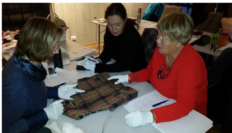
Figur 13: Plagganalyse D6S 2015