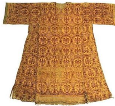
Figur 11: Bysantinsk drakt i silke fra 800-talet.