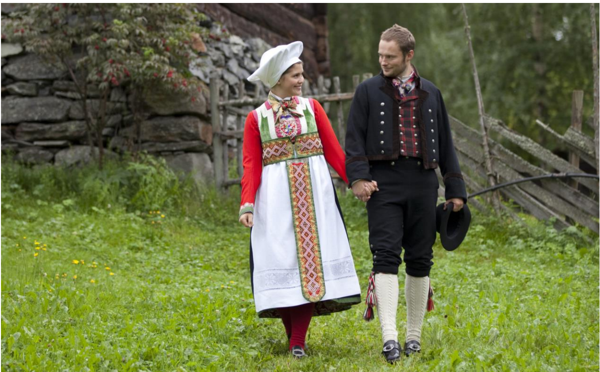
Figur 6: Fusa-bunad frå tidleg 1800-tal og Valdresbunad frå andre halvdel av 1800-talet.