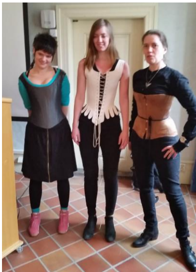
Figur 12: Prøving av korsett D6S

Ei særleg utfordring som oppsto i 2015 var at NTNU ikkje lenger er i stand til å organisere studietilbodet Drakt og samfunn, etter ein omfattande tilsynsprosess av NOKUT. Universitet og høgskular i landet skal no stå for minimum 50% av undervisinga sjølv, på fag i samarbeid med eksterne aktørar. Det vil bli ei stor utfordring for NBF å finne éin høgskule eller eitt universitet som har ein så stor drakt- og tekstilfagleg kompetanse. Truleg vil faget måtte finne ei anna form og storleik. Det er eit mål for 2016 at ein finn ei løysing for vidareføring av faget.