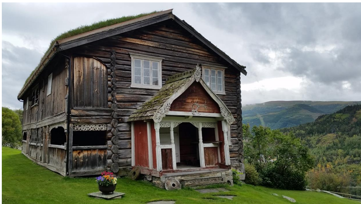
Figur 14: På feltarbeid på Håkenstad Gard i Vågå, hausten 2015.