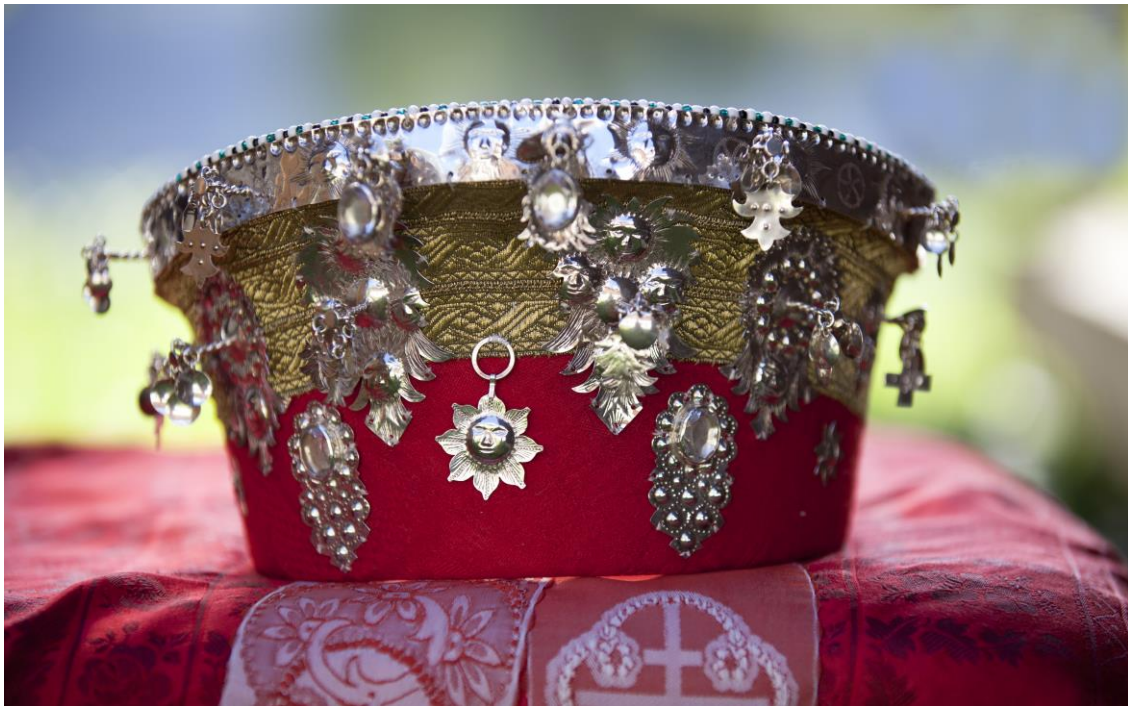
Figur 9: Kronelad frå Øvre Valdres.