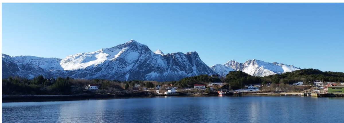
Figur 5: Med båt på feltarbeid langs Helgelandskysten, mars 2015.

I samband med den nasjonale kartlegginga av eldre draktskikk i Noreg har NBF i 2015 gjennomført seks feltarbeid. Det gode samarbeidet med lag eller institusjonar i lokalmiljøet er avgjerande for at feltarbeida blir vellukka.