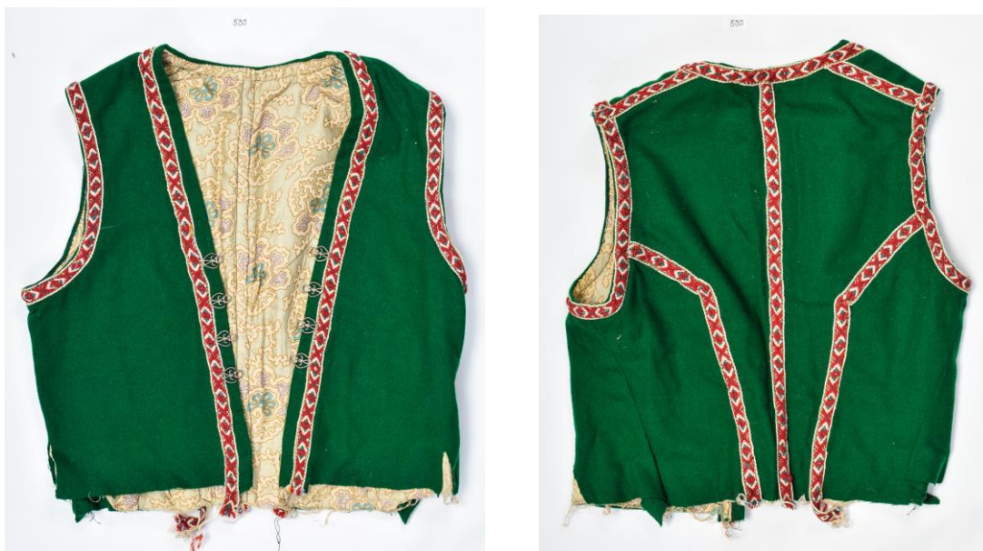
Figur 4: Eit snøreliv frå Sunnmøre

NBF har eit stort arkiv av registrerte draktplagg frå heile landet. Størstedelen av desse plagga er i privat eige, og ein mindre del i museumseige. Draktforskning har i internasjonal samanheng stort sett vore basert på museumstilfang, så eit slikt arkiv er unikt. Folkedraktmaterialet står sentralt i dokumentasjonsarbeidet, men det er også viktig for oss å dokumentere bunadshistoria.