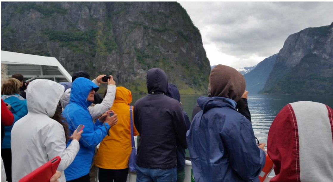
Figur 16: På veg frå Bergen til Flåm gjennom Sognefjorden, Nordisk draktseminar, august 2015.

Seminaret vart særst vellukka, og NBF fekk gode tilbakemeldingar frå deltakarane. Alle foredrag under seminaret vart publisert i ein rapport som blir utgjeven i 2016.