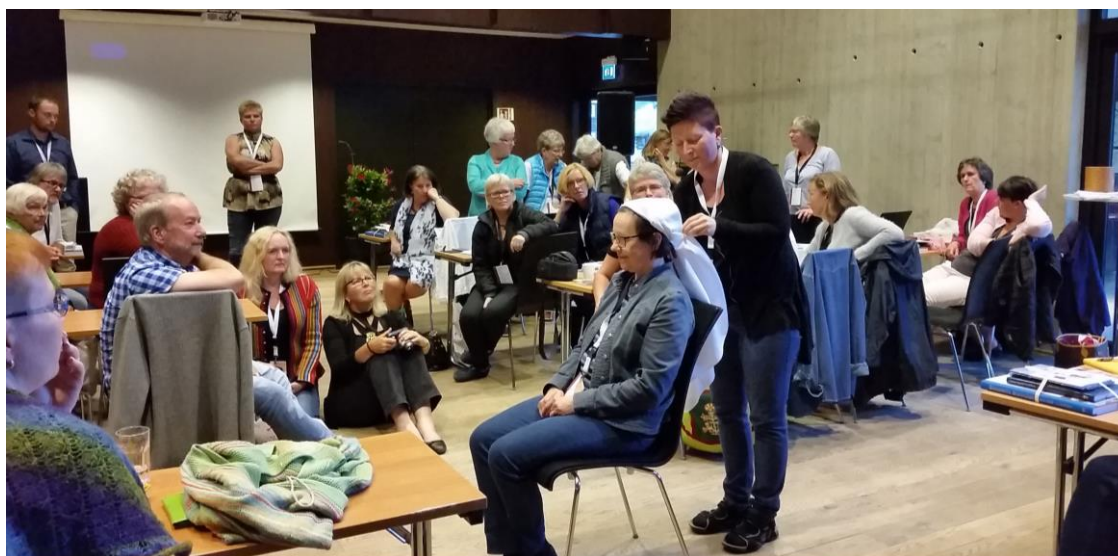
Figur 17: Demonstrasjon av påkleding av hovudplagg frå Finland, under Nordisk draktseminar, august 2015.