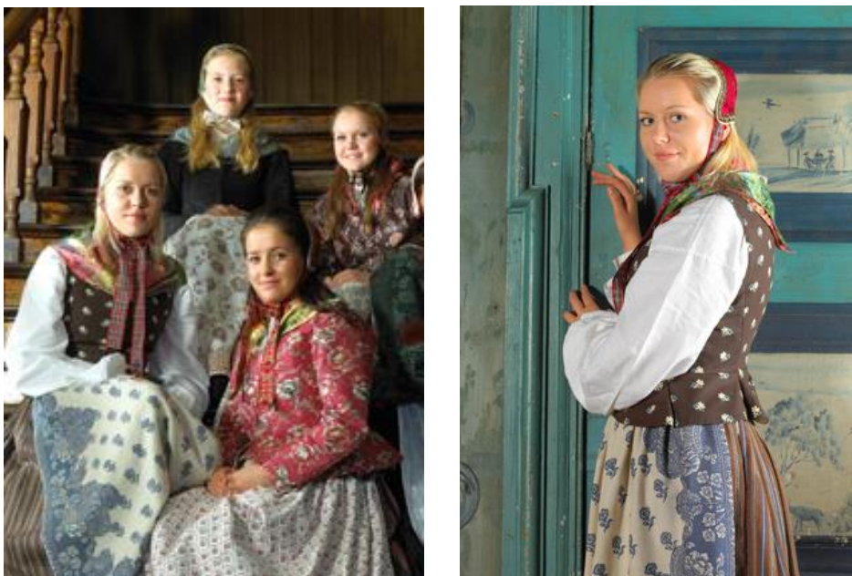
Figur 7 og 8: Rekonstruerte bunader frå Ryfylke.