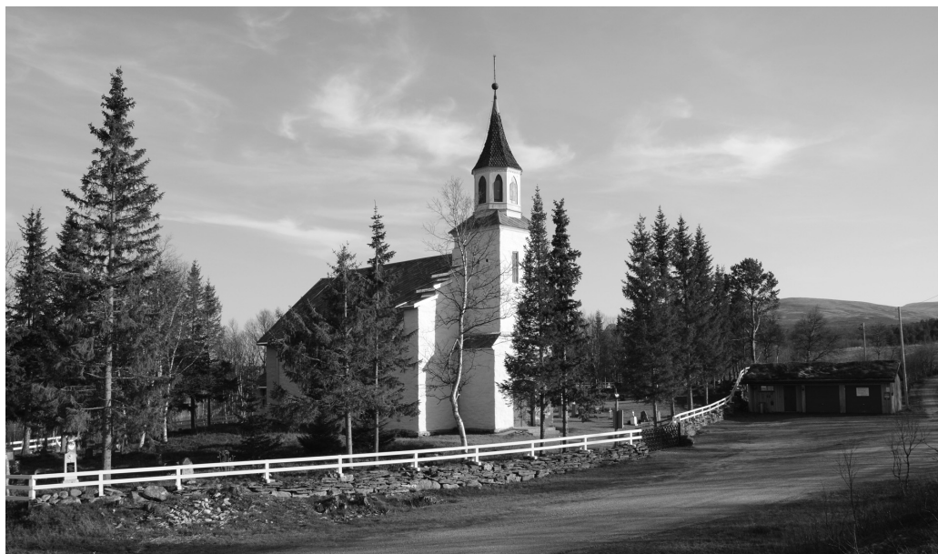
Narbuvoll kirke 2012.