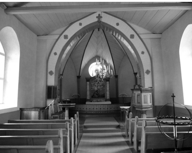
Interiør med gotisk bue og krysshvelv i taket på koret.