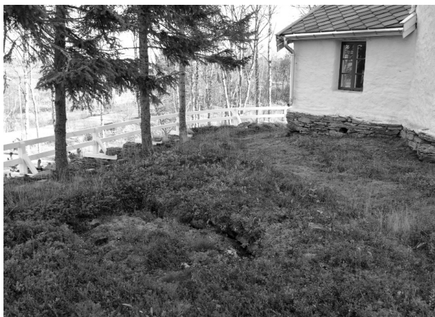
Vintergrav på nordsiden.

Kirka på Narbuvoll blir i enkelte sammenhenger kalt for Nord-Østerdalsdomen, et navn den med rette