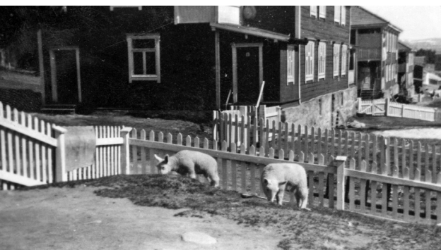
To lam beiter i hagen ved ei av brakkene på verket. Privat foto.

Med ull fra egne sauer kunne hun dekke familiens behov. Og hun strikka også for andre, noe som ga ei lita inntekt som bidrag til levemåten.