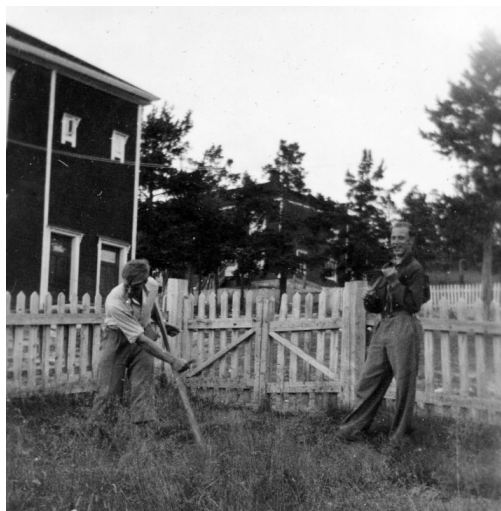
Ljåslått ved brakke på Verket. Personene er ukjente.