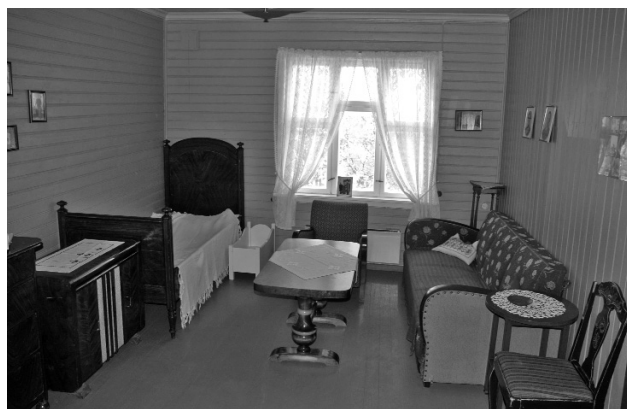
Stua i arbeiderleiligheten.

Møbleringa var minimal. Med leilighetene fulgte det noen veggfaste skap og en vedkomfyr. Resten måtte arbeiderfamiliene ordne sjøl. På kjøkkenet var det vanlig med en liten kjøkkenbenk, et bord og noen taburetter, og ofte ei seng. På stua var det en kommode og noen senger, eventuelt et lite bord, og kanskje en sengebenk. Noen få kunne sjå seg råd til å kjøpe en sofa. Til seng for de minste barna snekra en gjerne en karm, som vart skjøvet under ei seng om dagen. Sofaer og lenestoler hører etterkrigstida til i arbeiderleilighetene.