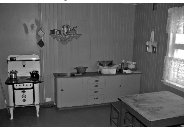
Kjøkkenet i arbeiderleiligheten.

Fra 1930-åra begynte ei forbedring av boforholdene. Leilighetene vart utvida til tre rom, ved at antall leiligheter vart redusert og rom i tidligere midtleiligheter vart gjort om til soverom for endeleilighetene. Endringene skjedde på ulikt vis og til forskjellige tider i de forskjellige brakkene. Utvidelsene fortsatte etter krigen, og endte i stor grad med leiligheter med til sammen fire rom og oppimot dobbelt så stort areal som opprinnelig.