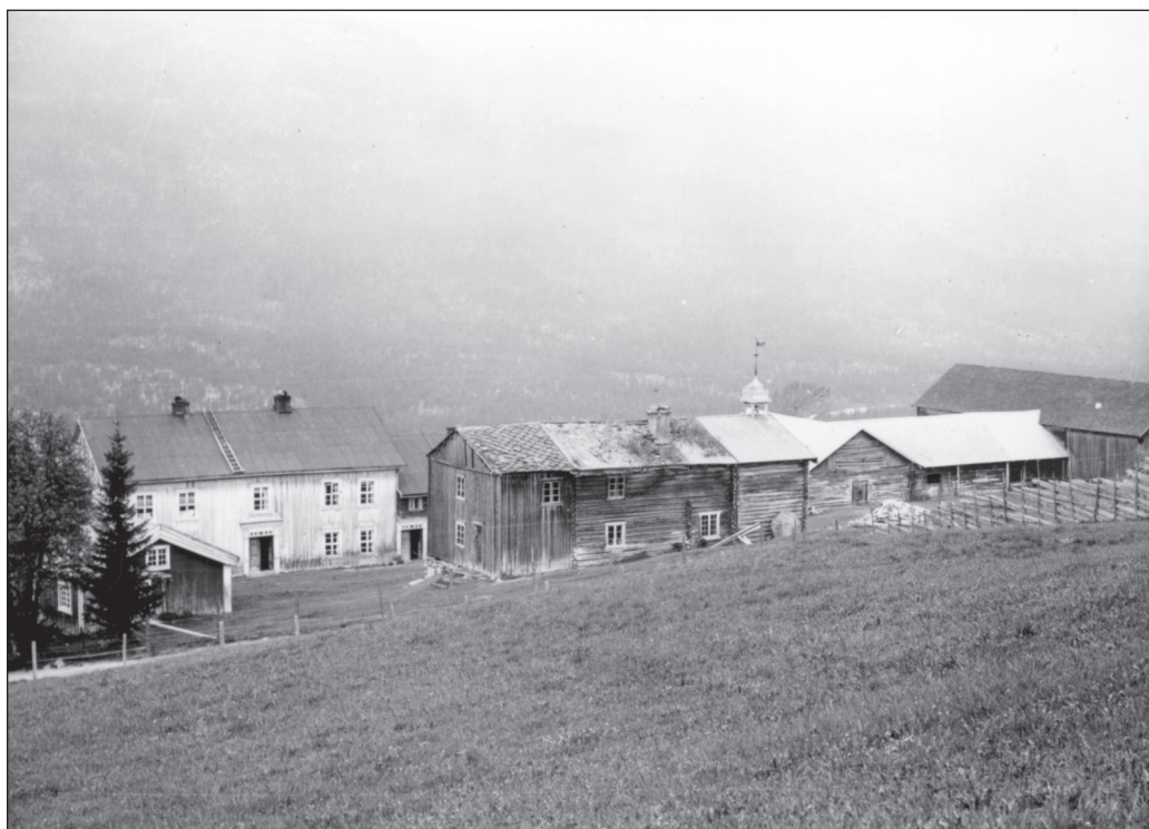
Nestu Unset, ca. 1940. (Foto P.K. Lien L6804).

gifte barn. Andelen gårdbrukere som hadde gifte barn boende falt med 11%-poeng, noe som tilsvarer den samlede nedgangen i andelen "tregenerasjonsgårder".