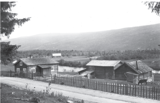
Lilleenget, nordre, Øvre Rendal, ca. 1940.

For svigerdatteren kunne det å dele hus og kjøkken med svigermor bety det samme som stadig å bli passet på og overvåket. Det er klart at man kunne lære mye viktig av en dyktig husmor, men hun kunne også bruke denne kunnskapen til å holde den nye kona på plass, og styre husholdet etter sitt forgodtbefinnende. Selv om bestefedre var gode å ha som barnepassere, ga det større prestisje for dem å bidra i det produktive arbeidet. Det var der husmørene kunne vise seg fram og få anerkjennelse fra familie og nærmiljø, og det kunne derfor være vanskelig for henne å tre tilbake, når hun fremdeles hadde krefter til å utføre arbeidet.