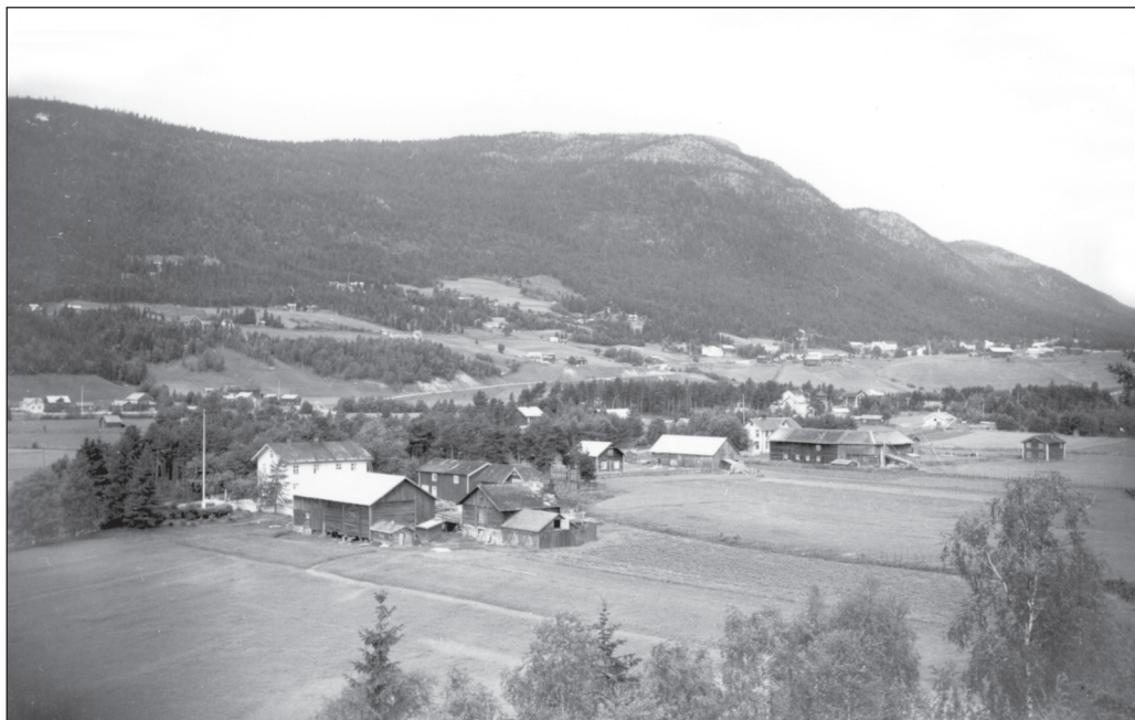
Moen søndre, Utistumoen og Nystu Mømb, ca. 1940.

de føderådsfolket i det samme huset som ungfolket. Dette gjenspeiler nok boligstrukturen på gårdene der de største brukene som regel hadde store toetasjes bygninger, mens mindre gårder måtte holdes seg til den gamle østerdalsstuen. Både de små og de store gårdene hadde likevel flere bolighus på gården i form av vinterstue og sommerstue.