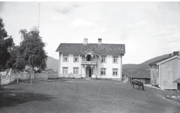
Gammelstu Bergset, ca 1940. (Foto P.K.Lien L6803).

hode helt til sin død, og at det først var da sønnen overtok. 12 I 1801 var det skjedd en endring. Gårdene ble overført tidligere enn før, og det var et større sammenfall i tidspunktet for giftermål og for overtakelse av husbonderetten. I 1865 hadde den nedadgående trenden stoppet opp som følge av de utsatte overføringene i Engerdal. 13 I 1900 var det bare et fåtall gifte barn som ventet på å overta. Den yngre generasjonen overtok i stor grad i forkant eller i forbindelse med giftermålet. Det var f.eks. flere som hadde overtatt gården som ugifte, selv om både far og mor var i live, for deretter å gifte seg. Dette kan muligens ha åpnet for en større frihet fra arvingens side i valg av kone.