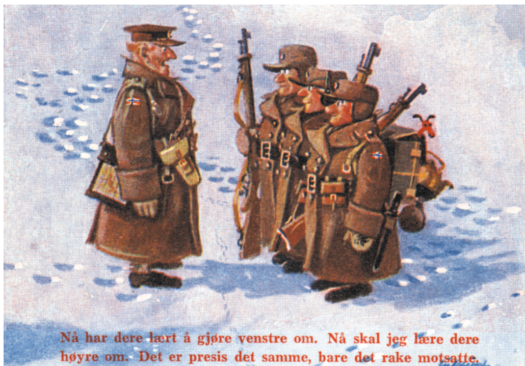
Militær humor: Ett av en serie på fire kort utgitt av Forsvarets kantiner i 1957.

bukse med bot i baken. Norske nisser slik norske nisser skal være, og i desidert norskeste laget under okkupasjonstiden. Den røde toppluen var i likhet med bindersens i jakkeslaget et motstandssymbol som ble forbudt ved lov allerede i 1941. Også på postkort! Av den grunn er det lettere å finne postgåtte kort med røde nisseluer stemplet i 1945 enn i løpet av de fire foregående årene til sammen. Men i det store og hele er Kjell Aukrusts omfattende produksjon av julekort på 40-tallet forholdsvis lett å få tak i.