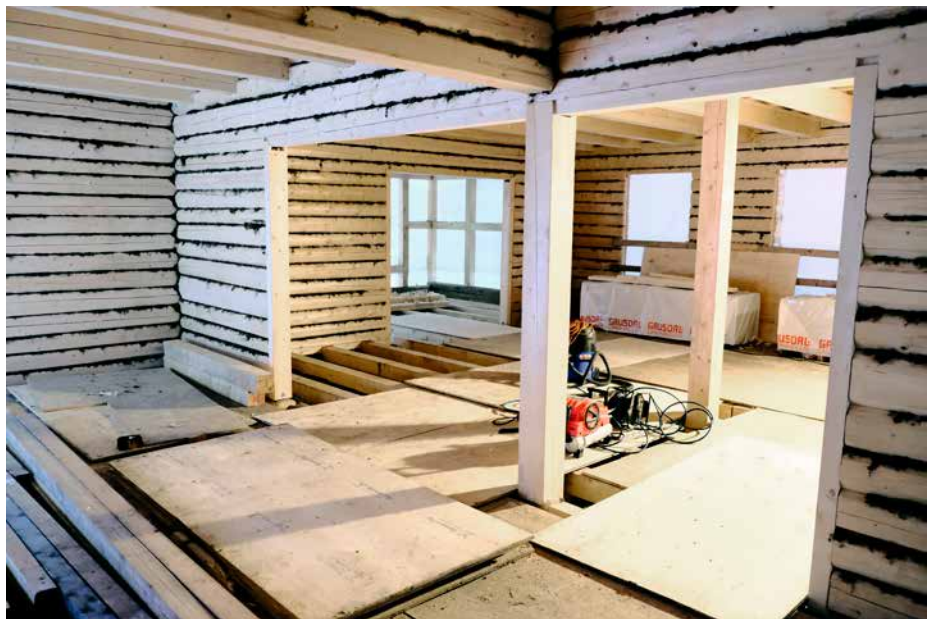
Teknisk avansert: Varme og ventilasjon er lagt i gulvet.

Drøbak Hospital fra 1793 som har vært forbilde for denne gjenoppbyggingen. Det gir oss en sikkerhet når vi velger metoder. Lokalt sitter vi på mye kunnskap som kommer til nytte nå. Det kan være små detaljer fra et enkelt fotografi tatt for 30 år siden, som gjør at vi får tilbakeført paneler og vinduer med eksakte glassmål, sier Færgestad.