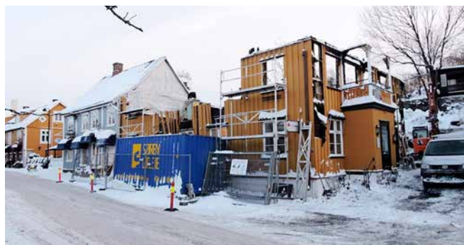
Januar 2016, etter at det gjenværende tømmeret i andre etasje var merket og demontert.