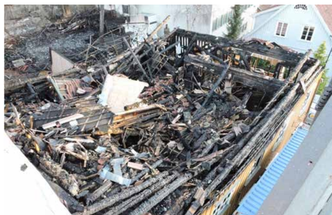
Utbrent takverk og andre etasje, sett fra lift fra nordvest.

Forsikringsselskapet mente Telegrafren var totalskadet og burde rives etter brannen. De ville bygge nytt i moderne bindingsverk. Det godtok ikke huseier og Frogn kommune. Her måtte man ta vare på så mye historisk materiale som mulig. Men hva kunne reddes? →