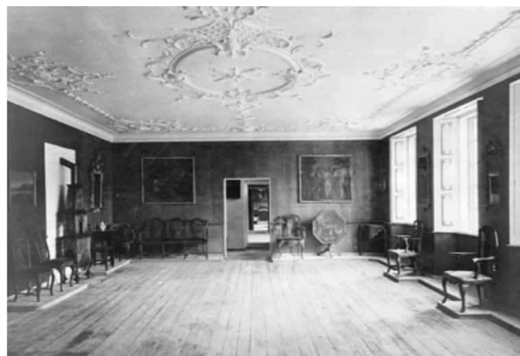
Høyre: Salens rike stukkhimling fotografert etter at det var remontert på Norsk Folkemuseum. Himlingen ble senere demontert. I 1785 startet Deichmanske bibliotek sin virksomhet i dette rommet. Senere ble det brukt som statsrådssal.