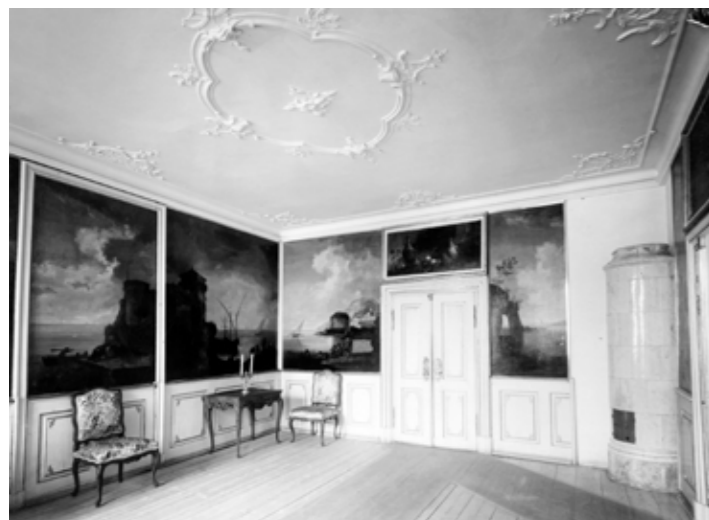
Venstre: Rommet fotografert etter at det kom til Norsk Folkemuseum. Legg merke til at vegglerret til venstre og brystpanelet under er montert inne i en kraftig omramming, mens brystpanelet til venstre for ovnen er saget rett over.