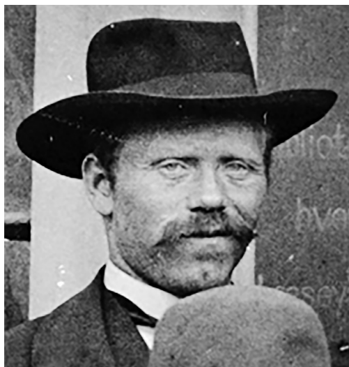
Hans på landsmøte i Bergen i 1902.

Leveraas. Seinere fikk Hans ytterligere en halvbror og en halvsøster. Om hans skolegang vet vi kun at han gikk ett år (1884-85) på Okkenhaug skole. Hans måtte nok tidlig ta del i arbeidet på gården. Da han ble konfirmert, bodde han fortsatt på Leveraas, men like etter konfirmasjonen var han dreng på Mo gård i Levanger. Vi vet ikke hvor lenge han var der.