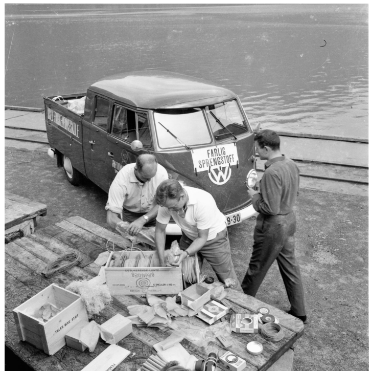
Dynamitten blir gjort klar.