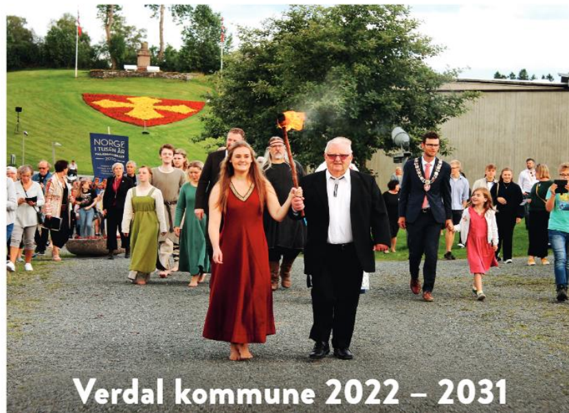
Verdal kommune 2022 – 2031