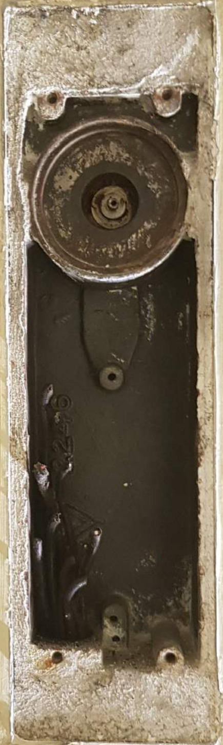
Fra Gestapomuseet. Foto: Cathrine Løvaas