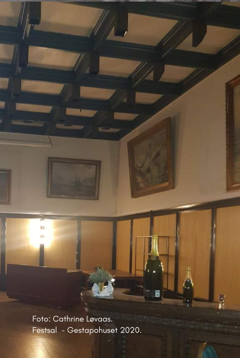
Festsal - Gestapohuset 2020.