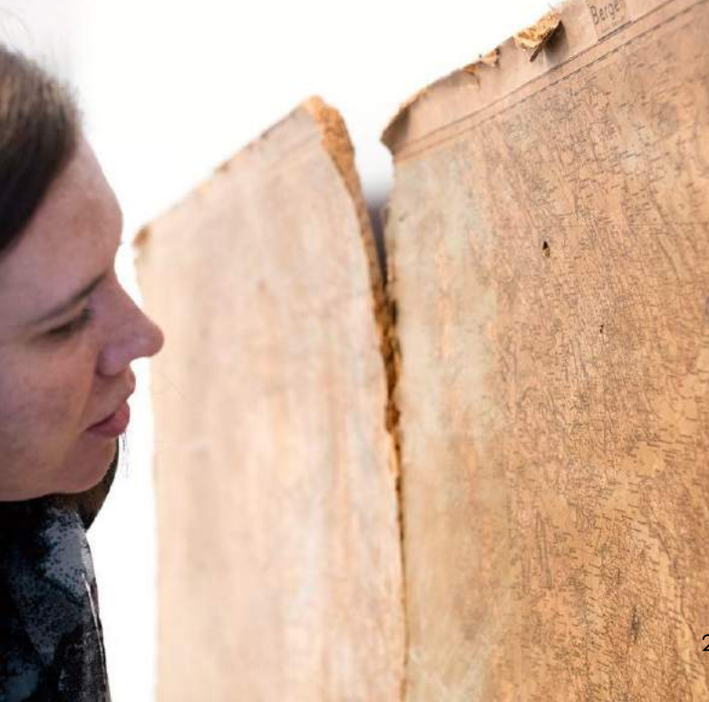
Veggkart fra Gestapohuset granskes på Politihuset.