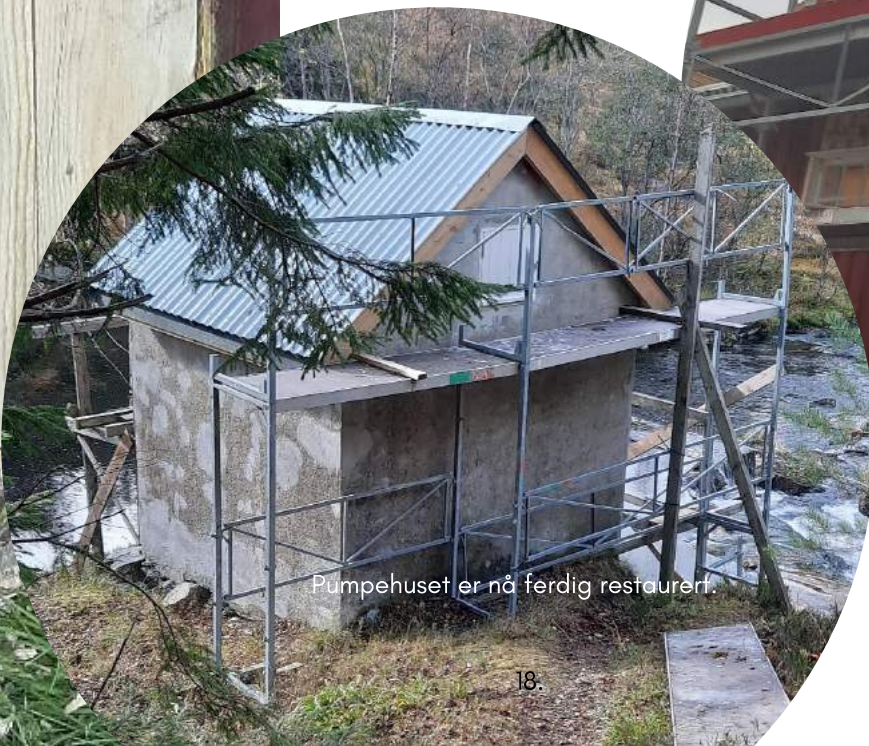
Pumpehuset er nå ferdig restaurert.