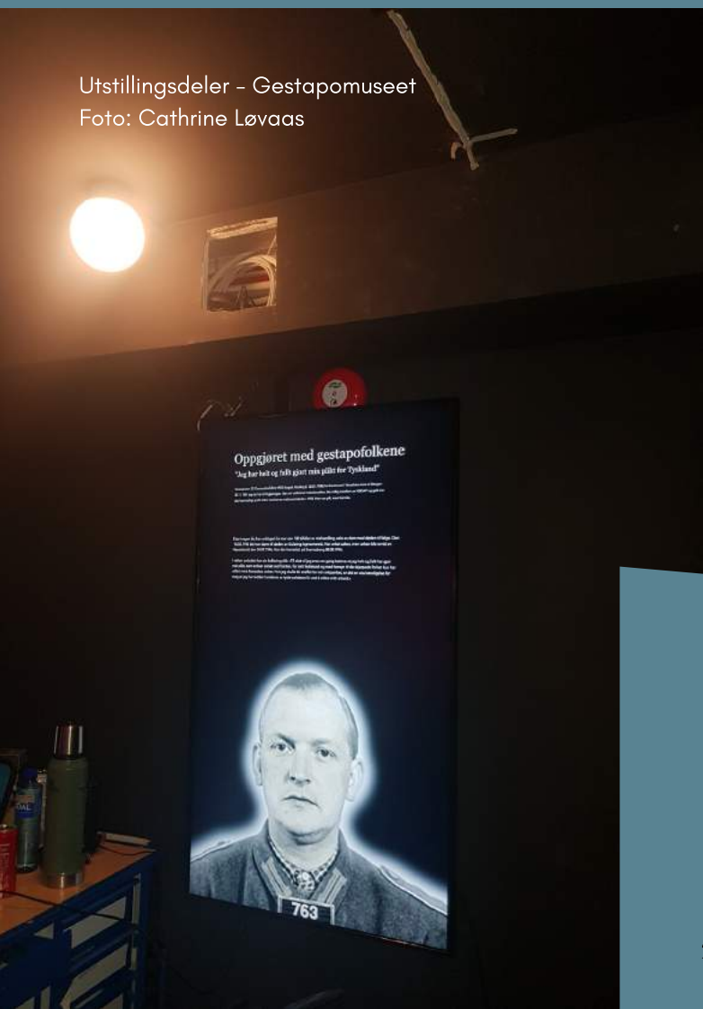
Utstillingsdeler - Gestapomuseet

Tiden er for lenge gått til å belyse også det som tidligere ikke ble snakket om. Det er viktig å belyse også det som tidligere ikke ble snakket om. Det er viktig å belyse også det som tidligere ikke ble snakket om. Det er viktig å belyse også det som tidligere ikke ble snakket om.