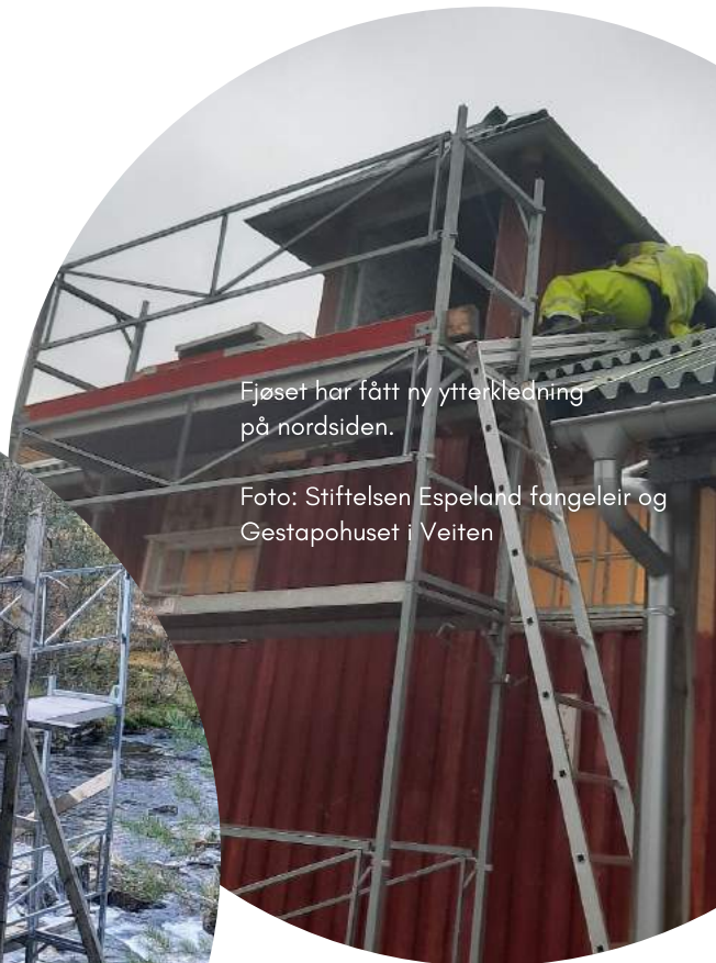
Fjøset har fått ny ytterkledning på nordsiden.