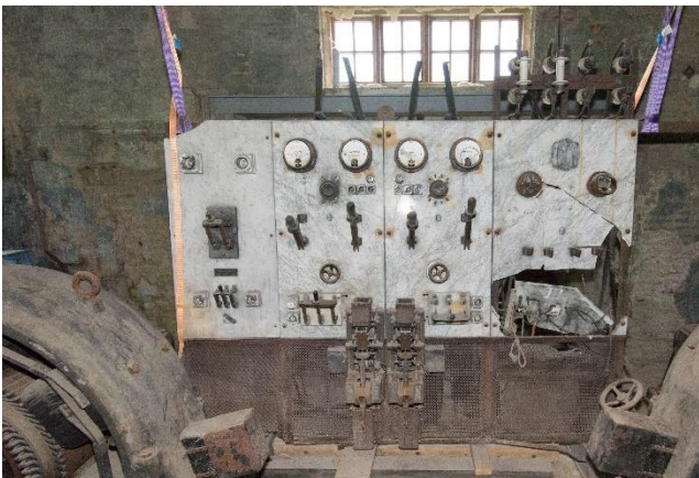
Interiør i gamle Valen kraftstasjon.

Fagleg og økonomisk er oppdragsverksemd viktig for NVIM, og dokumentasjonsprosjekt er den største satsinga. Fire medarbeidarar har arbeidd med å dokumentera Valen kraftverk for eigaren Hordaland fylkeskommune. Arbeidet gjekk inn i ein slutfase i 2016, med ferdigstilling av sluttrapport og formidlingstiltak. Noko arbeid står igjen, slik at endeleg leveranse på prosjektet vert i 2017.