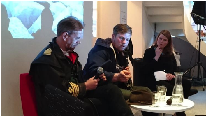
Fjorden Cowboys var ein av attraksjonane i museumsåret.

Elles hadde vi ølbryggingskurs med historisk foredrag på Vitensenteret. Eit innslag om krigens dagar i Odda i samarbeid med Odda kommune i kinosalen. Eit arrangement saman med Litteratursymposiet i oktober, og ein sær s vellukka Quiz-kveld i Statkraftstova i november.