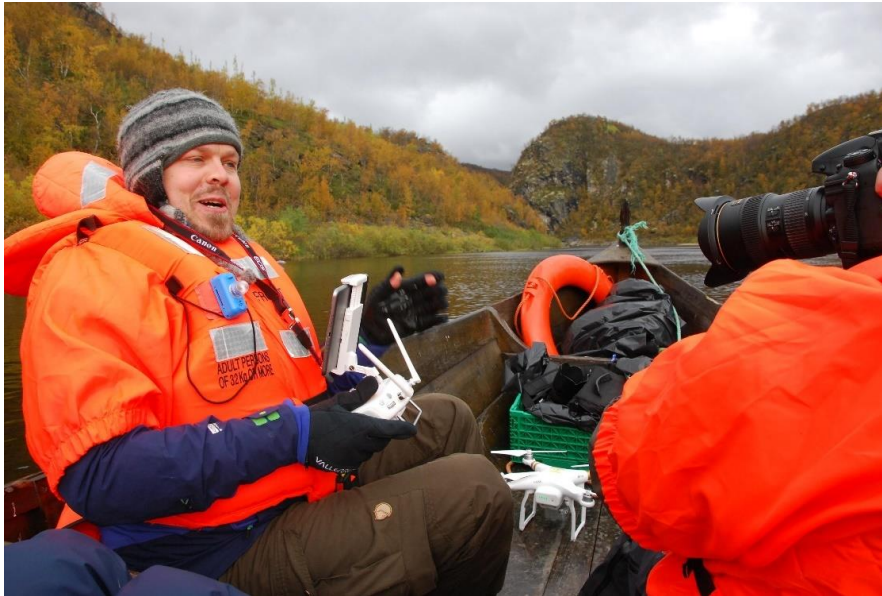
Dronefilming på Alta-elva under fagturen saman med NVE og Skogmuseet.

I september var vi med på feltarbeid i pilotprosjekt Longerak, der vi bidrog med utføring og testing av dronefotografering og fotogrammetri. I etterkant brukte vi ein del tid på utarbeiding av fotogrammetrisk 3D-modell av Longerak kraftstasjon og dam. Modellane er publisert på sketchfab.