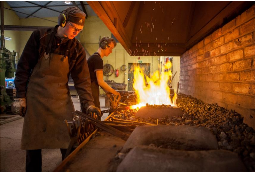
Elevar på smedlinja, Odda vidaregåande skole.

Daglegdags handverk på museet vert ofte ikkje tenkt på som immateriell kulturarv, men det er det. Både i vedlikehald og restaurering av verneverdige anlegg nyttar vi tradisjonelle teknikkar og produkt. Museet legg vekt på å føra denne kunnskapen vidare.