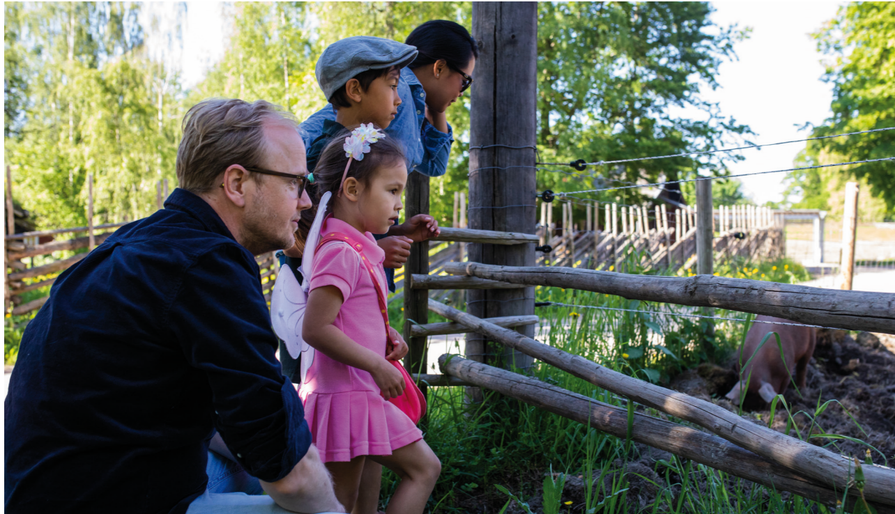
Dyrene på beite ved Trøndelagstunet på Norsk Folkemuseum er populære for både store og små.