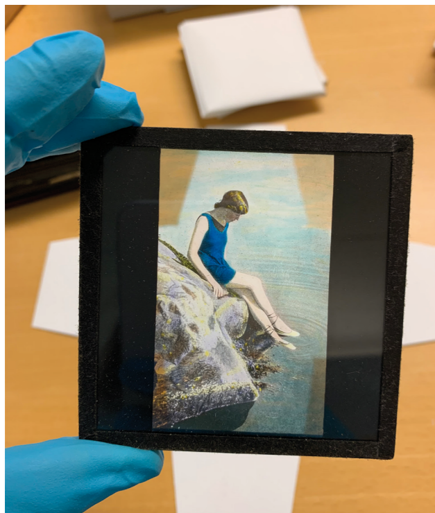
Lysbildearkivet etter Peter J. Sørå, sekretær for IOGT i mellomkrigstiden, er et av arkivene som ble pakket om i løpet av året Foto: Anja H. Langgât.