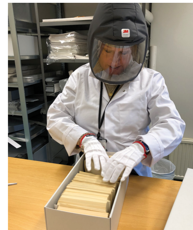
Else tar HMS på alvor.

Vi har digitalisert ca. 101 240 sider analogt materiale. Lesesalen har hatt 32 besøk og det har vært lånt ut 158 arkivsaker. Vi har mottatt og besvart 240 skriftlige henvendelser gjennom saksbehandlersystemet.