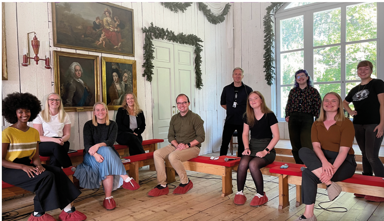
Riksdebatt 2021, Foto: Eidsvoll 1814.