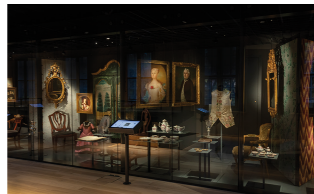
Den nye utstillingen TIDSRUM 1600-1914.

Norsk Folkemuseum er et kulturhistorisk museum som viser dagliglivets historie fra 1500 til i dag. I tillegg til et stort friluftsmuseum med bygninger fra hele perioden, har museet faste utstillinger innen blant annet draktskikk, folkekunst, kirkekunst, samisk kultur og leketøy. Museet er organisert i fire seksjoner: bygningsantikvarisk, kulturhistorisk, formidling og drift.