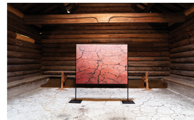
«Bloodline» i Raulandstua.

Av mindre, temporære utstillinger presenterte Ida Lorentzen malerier med motiver fra Norsk Folkemuseum: installasjonen «Bloodlines» i Raulandstua og «Historien om 12 malerier» i Utstillingshallen. Fotoutstillingen «Middag i Norge 2020» med bilder av Andrea Gjestvang ble vist utenfor Obosgården - Wesselsgate 15. Utstillingen er produsert av MatPrat og viser 26 ulike husstander mens de spiser middag.