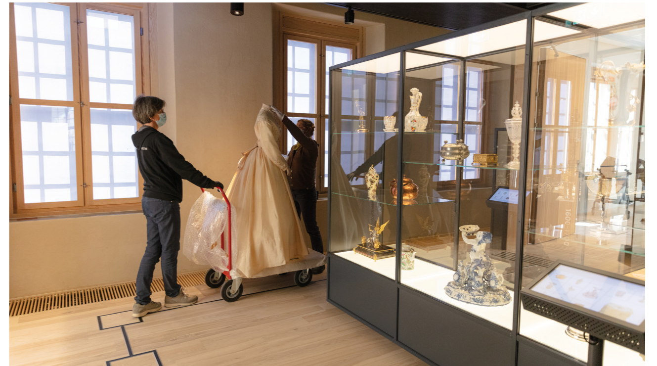
Fra arbeidet med utstillingen «Tidsrom 1600 – 2014» på Norsk Folkemuseum.

Sjølv om dette utgjør berre 35% av besøket i 2019, var det