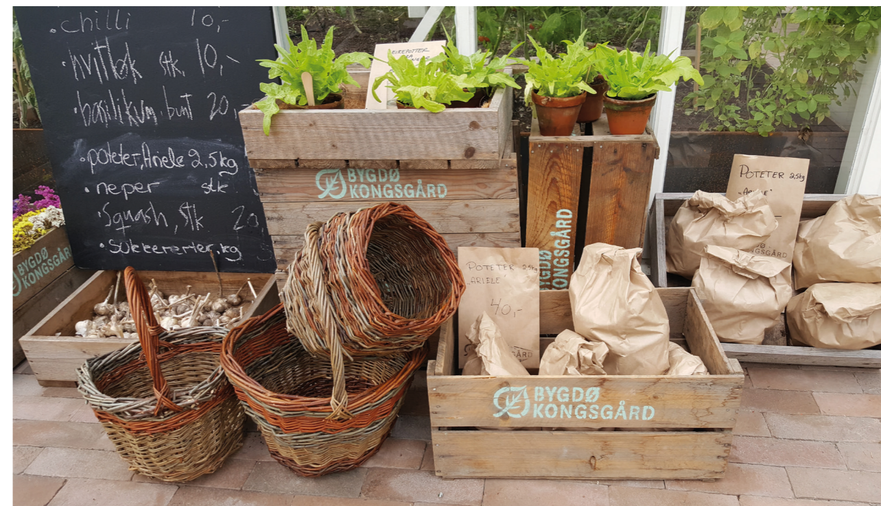
Butikk i Gartneriet.

Hagebruket i Gartneriet og på Gården har gitt gode avlinger som danner grunnlaget for serveringen sammen med leveranser fra ysteriet og tilgangen på kjøtt fra gårdsbruket. Store deler av 2021 har serveringen vært påvirket av diverse corona-restriksjoner. Dette har gjort at vi ikke har kunnet utnyttet serveringen fullt ut, men i de «åpne» periodene har det vært gjennomført diverse selskaper og andre tilstelninger