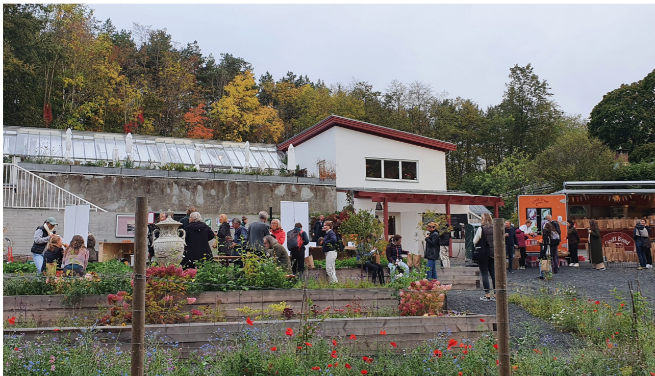
Åpen dag Gartneriet.