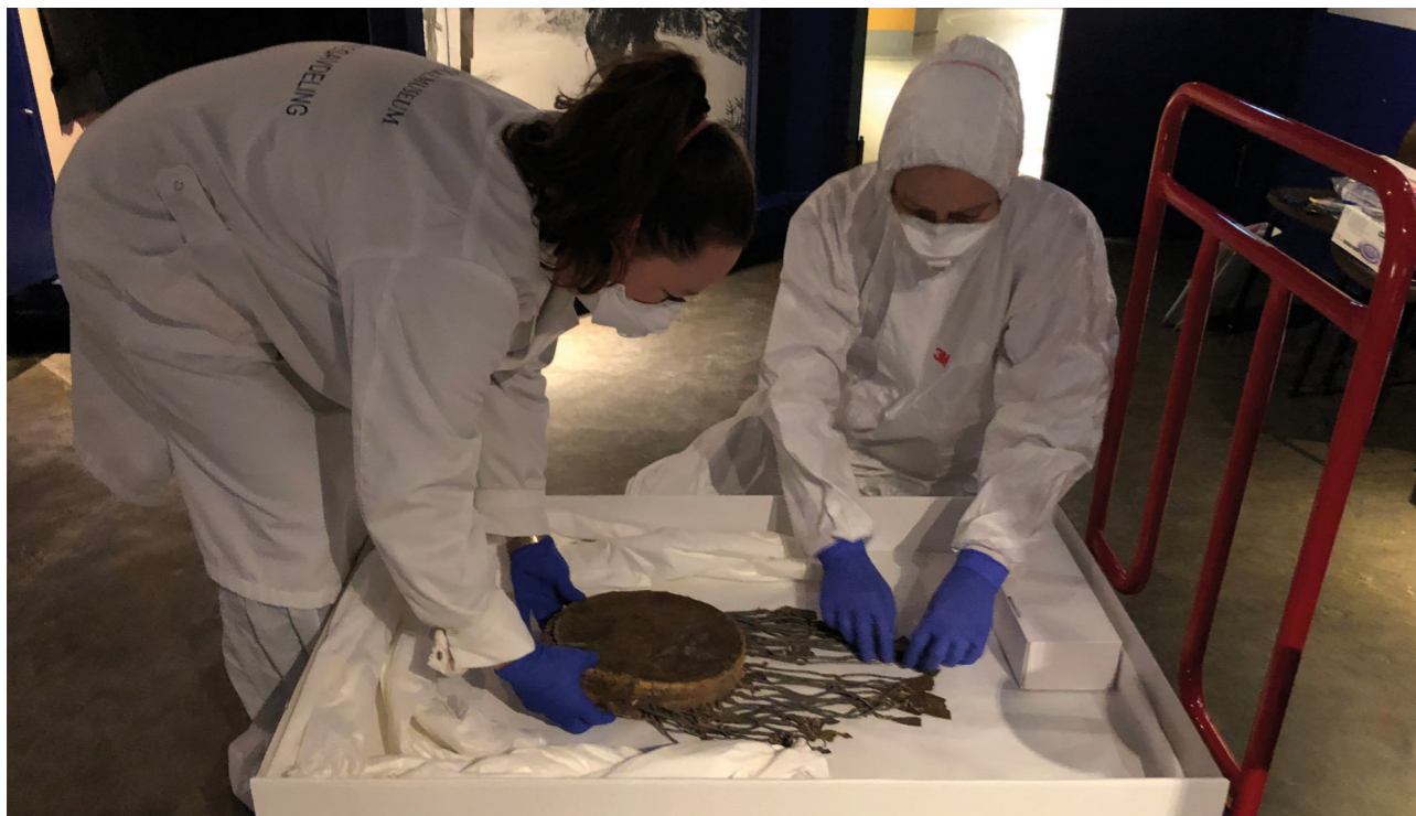
Samisk runeboomme. Pesticid.