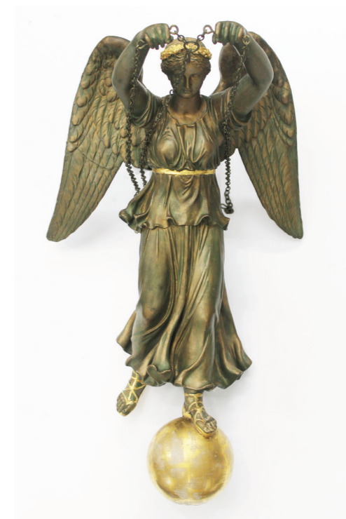
Konservering av Englelampe for utstillingen Tidsrom, før (til venstre) og etter behandling (til høyre).