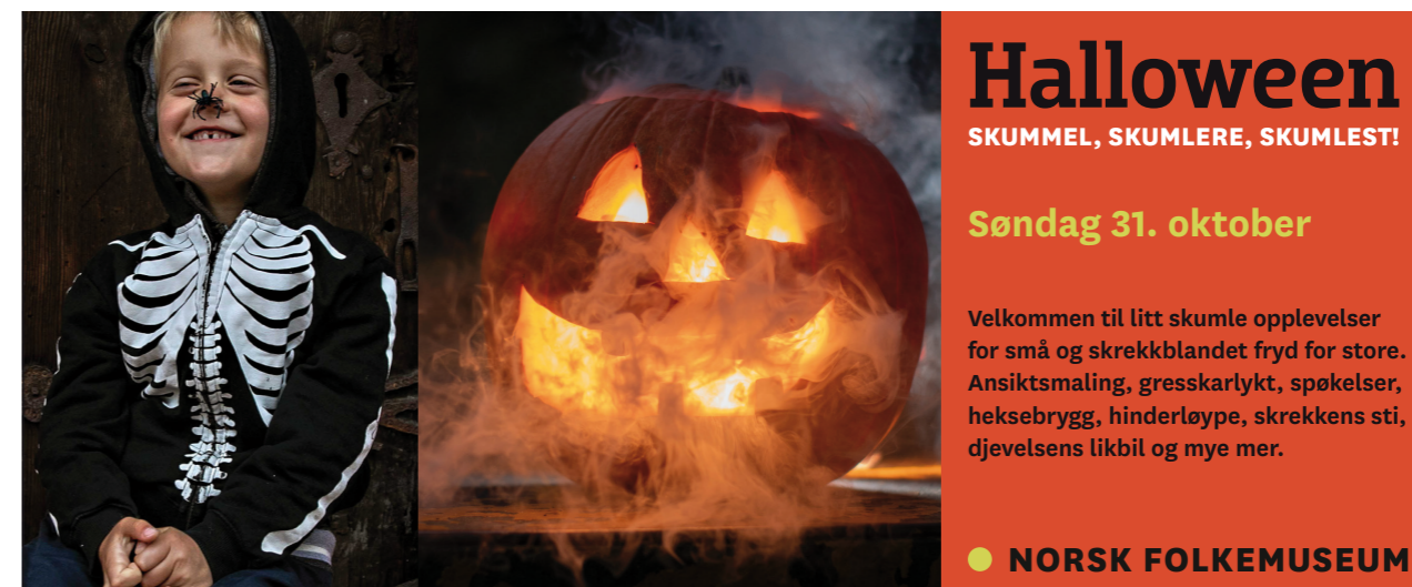
Skummel moro på Halloween. Norsk Folkemuseum.

Gir inngang til 5 museer for hele familien!