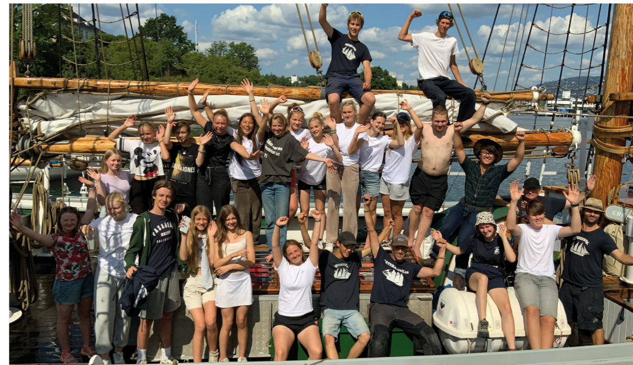
Ungdomsseilas på Svanen i 2021.

Arbeidet med rapportering, konservering og dokumentasjon knyttet til utgravingene i Bjørvika har vært en sentral opp-