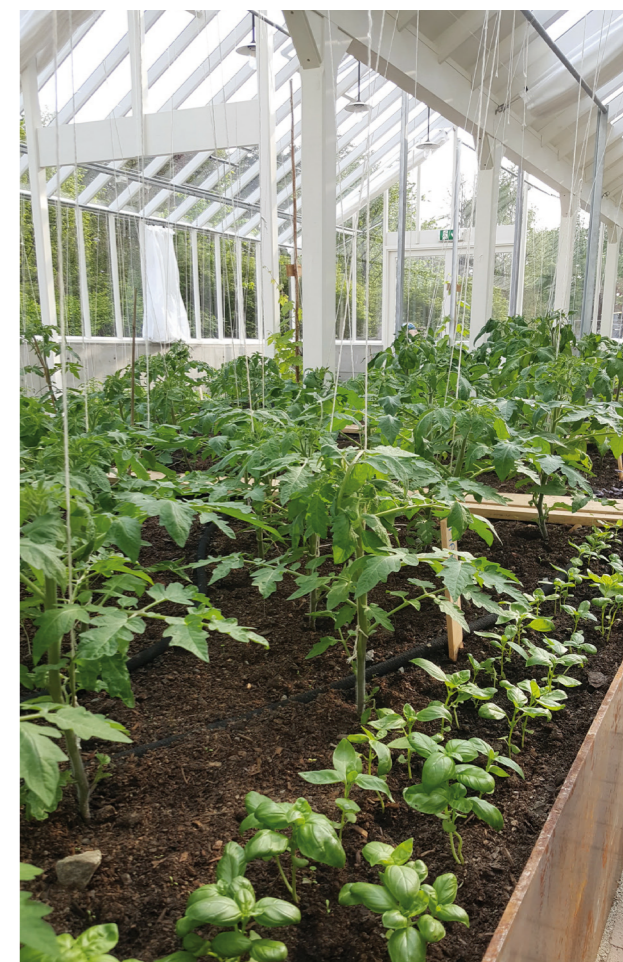
Planting i Gartneriet.

Det er gjennomført vanlig skjøtsel av arealene i friluftsmuseet og historisk landbruk har bidratt i landbruksrelatert formidling i friluftsmuseet. På Bygdø Kongsgård har det blitt ryddet langs mange av veiene i Kongeskogen og langs jordekanter.