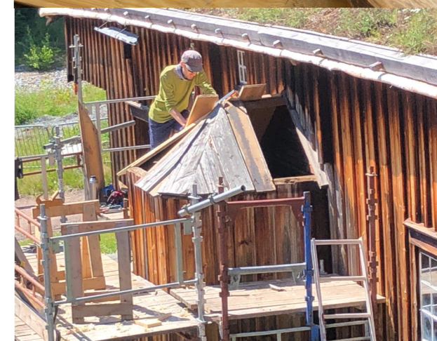
Antakvarisk vedlikehold i Friluftsmuseet.