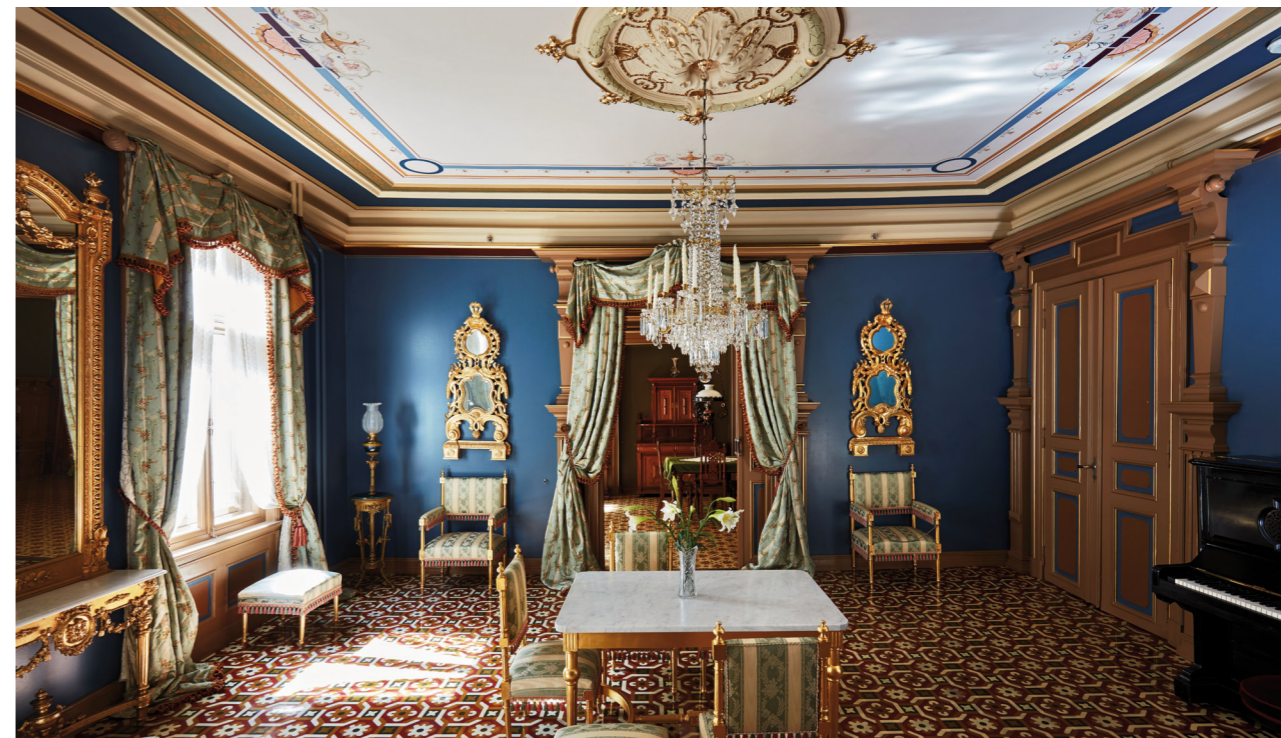
Den blå salong i Ibsens leilighet.

* For total oversikt over vedlikehold Norsk Folkemuseum - se vedlegg 1 på slutten av årsmeldingen.