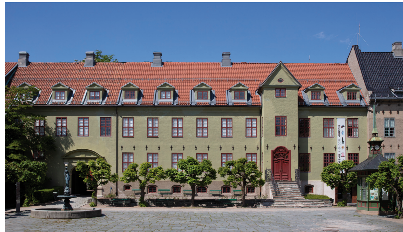
Bybygg på Norsk Folkemuseum.

* Se vedlegg 2 for liste over publikasjoner på slutten av årsmeldingen.