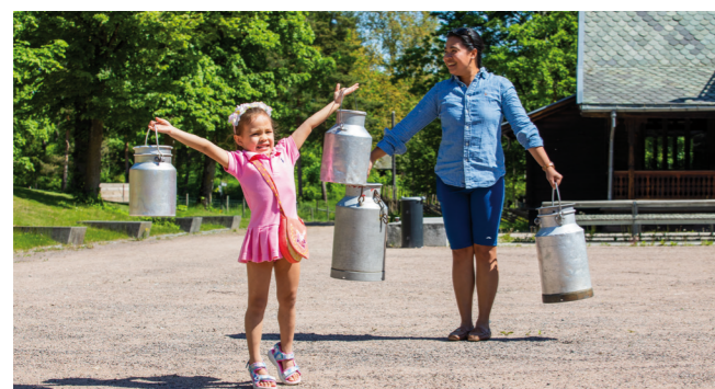
Illustrasjon av Sommerkortet 2021.

Det er rekruttert 2 nye medarbeidere til nyopprettede stillinger, en digital kommunikasjonsrådgiver og en markedsrådgiver til stiftelsen.