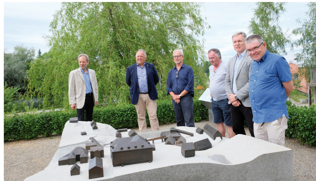
Avdukning jernverksmodell.

Av høydepunkter i 2021 vil vi trekke fram det nye sommertilbudet for barnefamilier, «Tidsreiser 1814», med vandreteater, spesialomvisninger, sommerkino og spesialtilbud i butikk og kafé. I september lanserte vi flere tilbud knyttet til Stortingsvalget 2021, med Riksdebatt, Førstegangsvelgeren, Demokratiets dag, og tilpassede omvisninger og digitale tilbud. Av forskningsaktivitet har vi avholdt siste seminar i prosjektet Founding Fathers across the Atlantic – history and legacy in Norway and USA med deltakere fra Argentina, Storbritannia, USA og Norge. Prosjektets bok 2, «Transatlantiske forbindelser – norsk-amerikanske relasjoner i 200 år», ble lansert i oktober. I tillegg har vi deltatt i tre forskningsprosjekter "In-