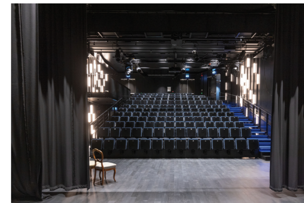
Teatersalen har plass til 133 gjester.

Gjennom aktiv bruk av dramatiseringar av Ibsenutdrag, ved tilsette skodespelarar, vil formidlinga bli fornya og levandegjort for nye grupper. Med teatersalen er det no endeleg rom for å kunne vise Ibsen for publikum på fast basis, i tre sesongar.