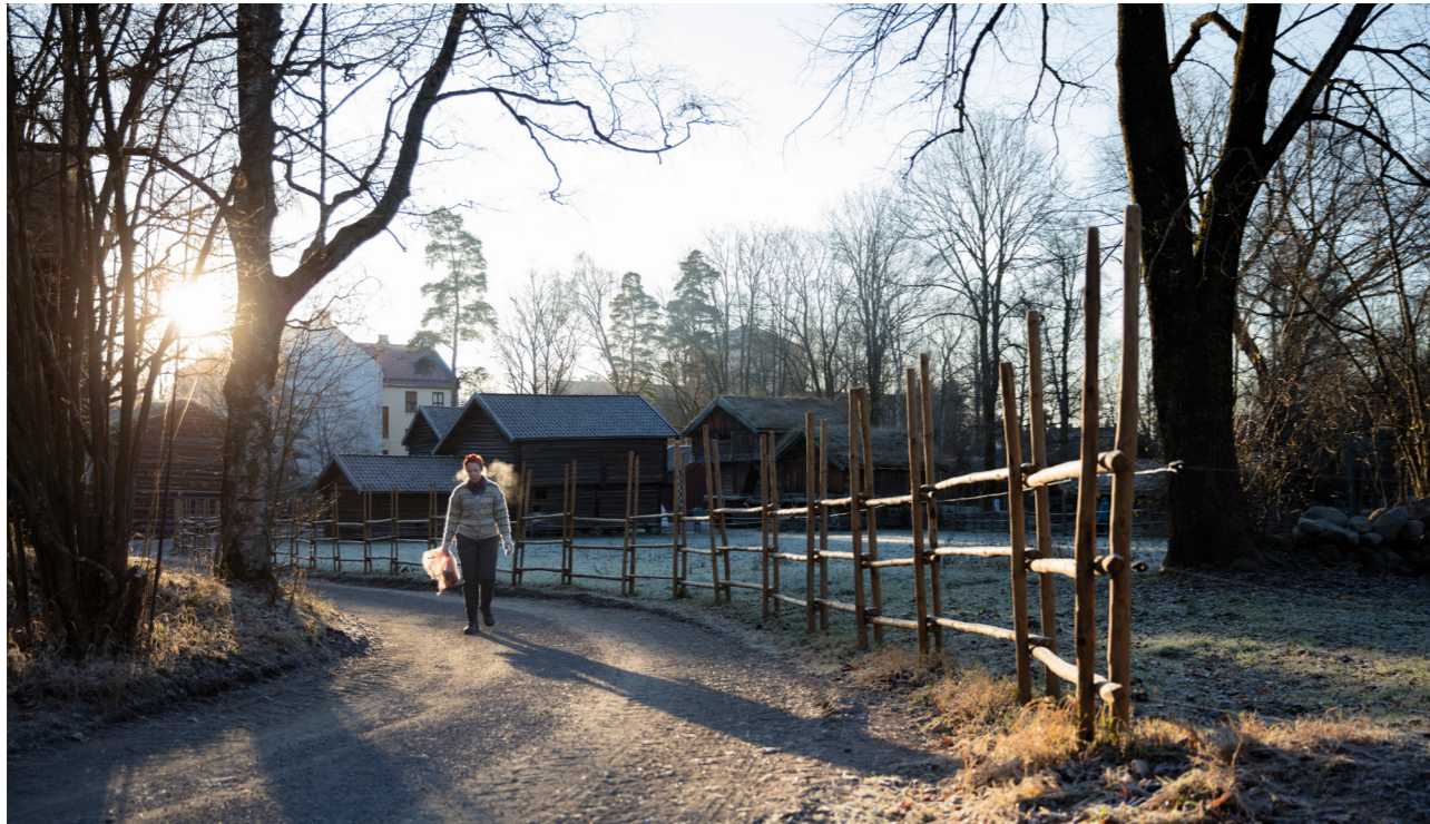
Museene i Oslo var stengt for publikum frem til 26. mai.