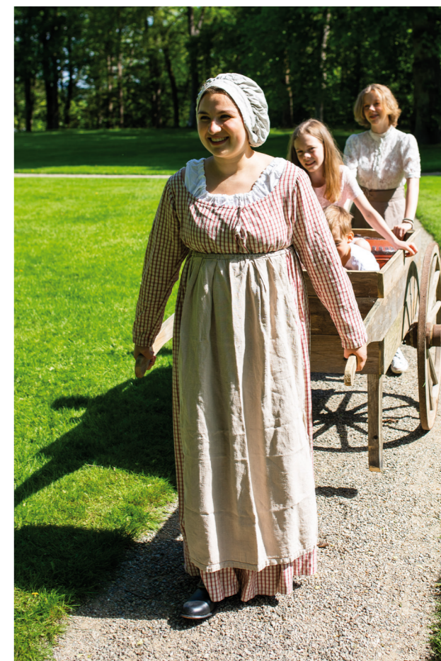
Vandreteater Tidsreiser 1814.

Foruten omfattende deltakelse i strategiarbeidet, har vi utviklet både digitale løsninger, nye tilbud rettet mot barn og ungdom, og fortsatt arbeidet med prosjekt Wergelands hus 2023 for videre innholdsutvikling, valg av samarbeidspartnere og anbudsprosess i 2022. Besøkstallene for 2021 var gode etter pandemiforholdene, men vi må jobbe videre med å utvikle Eidsvoll 1814 som en attraktiv turistdestinasjon for å sikre nytt publikum og gjenkjøp etter pandemien.