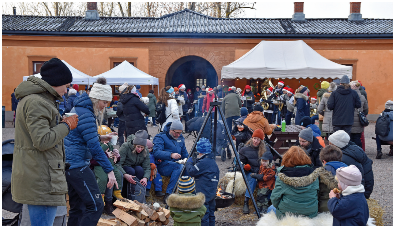
Jul på Bogstad.