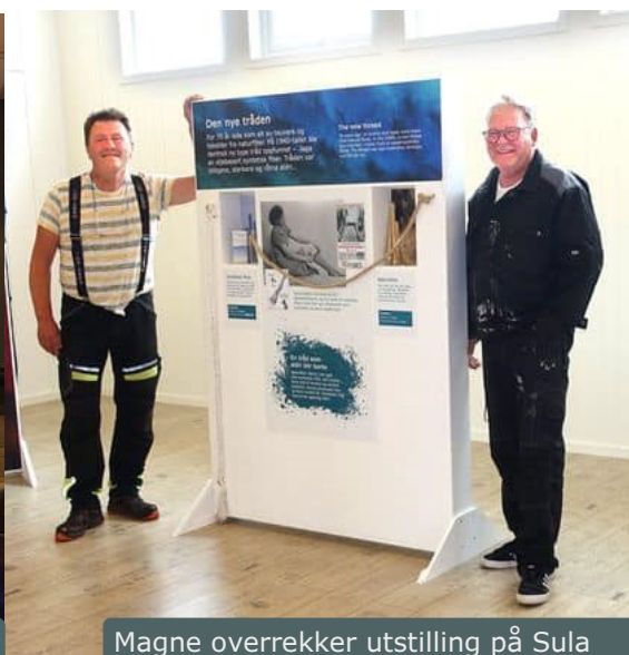
Magne overrekker utstilling på Sula