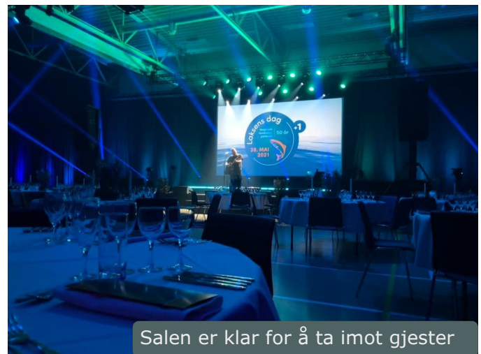
Salen er klar for å ta imot gjester