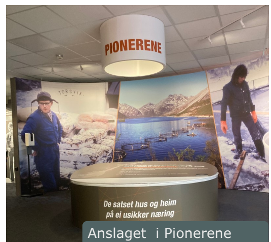
Anslaget i Pionerene

I utstillingen Pionerene har vi i 2021 endret den innledende teksten og laget filmvisning av filmen «Pionerene» i utstillingens auditorium, Ægirs hall. Dette er en film laget i forbindelse med Havrukshubileet 2020. Her møter du de som først prøvde seg i denne nye næringa og satset alt på ei usikker fremtid.