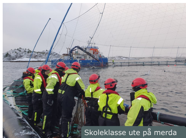
Skoleklasse ute på merda

Høstsesongen ble veldig bra da landet åpnet opp igjen etter betydelige restriksjoner. Vi fikk i løpet av september besøk av mange store studentgrupper fra NTNU. Vi hadde også «Norsk veterinærhistorisk selskap» på besøk. Gruppen bestod av et trettitalls pensjonerte veterinærer. Noen av disse var bortimot 90 år gamle og noen gikk kun ved hjelp av krykker. Vi må innrømme at vi ble litt skeptiske til å begynne med, men alle kom seg om bord i båten og opp på flåta. Videre har vi hatt besøk av elever fra Lysekil videregående skole i Sverige. Elevene her studerer naturbruk og har pleid å besøke Hitra flere år på rad. Andre besøkende har vært bl.a. Det norske veritas, ATEA, svenske forskere fra RISE (Research institute of Sweden), og flere.