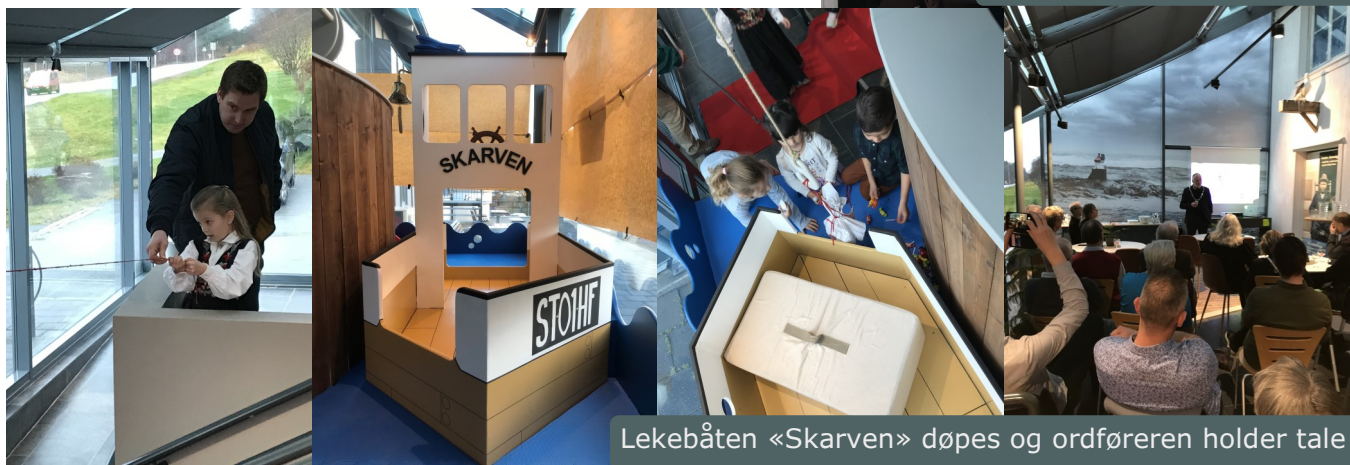
Lekebåten «Skarven» døpes og ordføreren holder tale