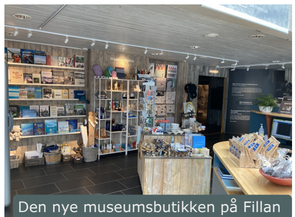
Den nye museumsbutikken på Fillan

Kystmuseet har to museumsbutikker; på Fillan og i terminalbygget på Sandstad. Her selges et bredt utvalg bøker, håndverksprodukter, suvenirer og gaveartikler. Begge butikkene har i løpet av året endret plassering i sine respektive lokaler. Museumsbutikken i Fillan fikk ny plassering i forbindelse med fornyingen av publikumsmottaket og har hatt både midlertidig plassering og vært stengt i under ombygningsperioden. Omsetningen gikk i år ned med 19% i forhold til i fjor. På Sandstad ble museumsbutikken flyttet nærmere inngangspartiet 1.februar. Her har butikken i 2021 økt omsetningen med 35% i forhold til året før.