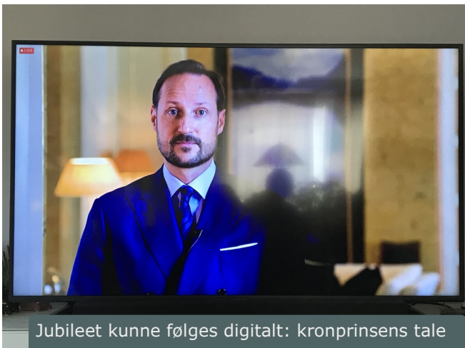
Jubileet kunne følges digitalt: kronprinsens tale

28. mai 2021 ble det arrangert havbruksjubileum 50 + 1 år på Hitra. Havbruksnæringens 50-års jubileum skulle egentlig gå av stabelen året før, men ble utsatt pga. smittesituasjonen.