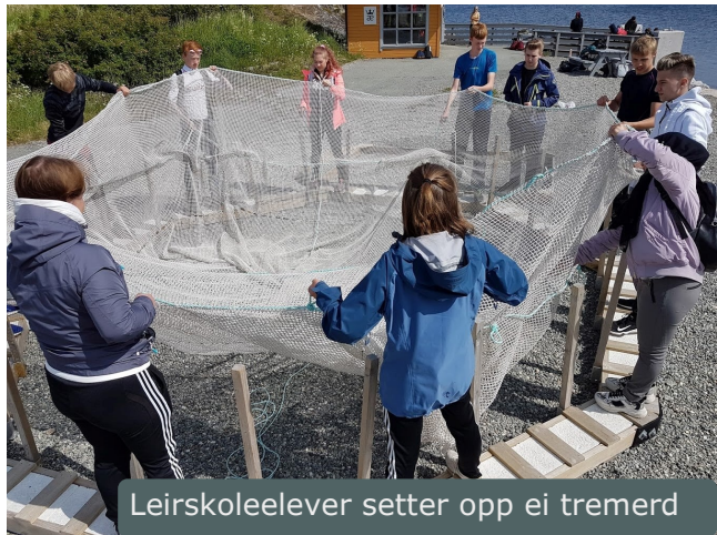
Leirskoleelever setter opp ei tremerd

runder med leirskoleelever både på våren og høsten.