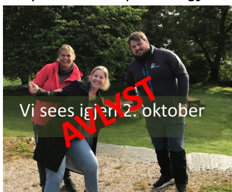
Vi sees igjen 2. oktober

I år planla vi vår første kulturminnedagsmarkering på museet. Men pga lokalt utbrudd i pandemien måtte vi først utsette og så avlyse. Men vi prøver igjen i 2022.