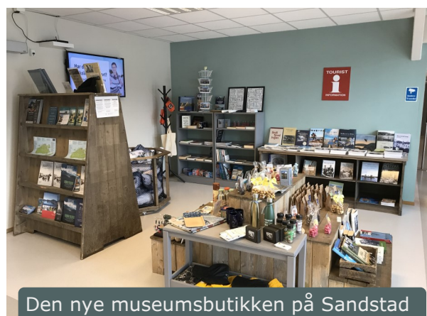
Den nye museumsbutikken på Sandstad