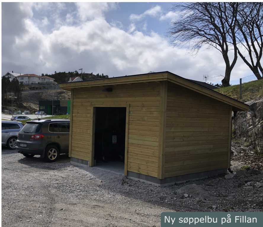
Ny søppelbu på Fillan

Vi fikk også oppført ei søppelbu i forhold til vedrørende brannforskrifter. Der har vi containere for restavfall og papir. I tillegg til lagring av utstyr for snømåking og strøing.