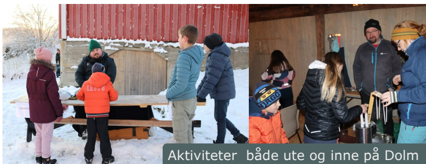
Aktiviteter både ute og inne på Dolm

Tradisjon tro arrangerte vi vårt førjulsarrangement «jul på museet». En aktivitetsdag for små og store. I år flyttet vi arrangementet til Dolm pga oppussing på Fillan. Dette ble stor suksess med 110 besøkende