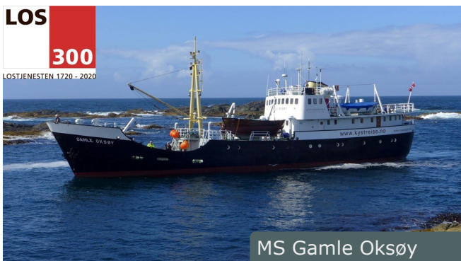
MS Gamle Oksøy

Feiringen av losvesenets 300 år lange historie i 2020 ble utsatt til 2021 på grunn av pandemien. I samarbeid med Kystverksmusea arrangerte Kystmuseet et besøk av det gamle forsyningskipet MS Gamle Oksøy. Båten la til kai den 14 juni på Knarrlagsund, hvor besøkende kunne bli med på etappen videre til Sandstad hvor båten ville bli liggende noen timer. En håndfull personer ble med på seilasen, og rundt 20 personer hadde møtt fram for å ta imot båten. Etter seilasen ble det holdt et foredrag om loshistorien i kafe Sjøsprøyt.