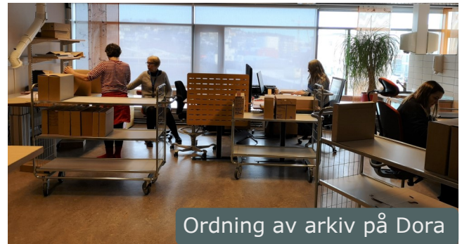
Ordning av arkiv på Dora

Per 31.1.2021 har vi ett arkiv ferdig sortert, registrert og publisert på Digitalarkivet. Det er arkivet etter Oceanor på litt over 11 hyllemeter. I tillegg har vi sortert og registrert ca. 60 hyllemeter arkiv etter Norske Fiskeoppdretteres Forening (NFF).