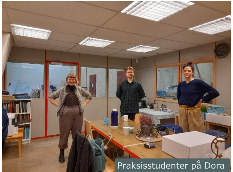
Praksisstudenter på Dora

2021 ble samarbeidet med NAV og vekstbedriften DalPro videreført slik at personer med ulike utfordringer kunne få arbeidstrening hos Kystmuseet. Her blir de inkludert i kollegiet ved museet og får relevante arbeidsoppgaver som bidrar til fremdrift i de ulike prosjektene. Tiltaket fungerer bra for alle involverte parter, utgjør ca 0,4 årsverk og finansieres via NAV. Også i 2021 har Kystmuseet tatt imot NTNU-studenter fra programmet Arkiv og samlingsforvaltning. Totalt fem studenter deltok i arbeidet på Dora med samlingsforvaltning og havbruksarkivene.