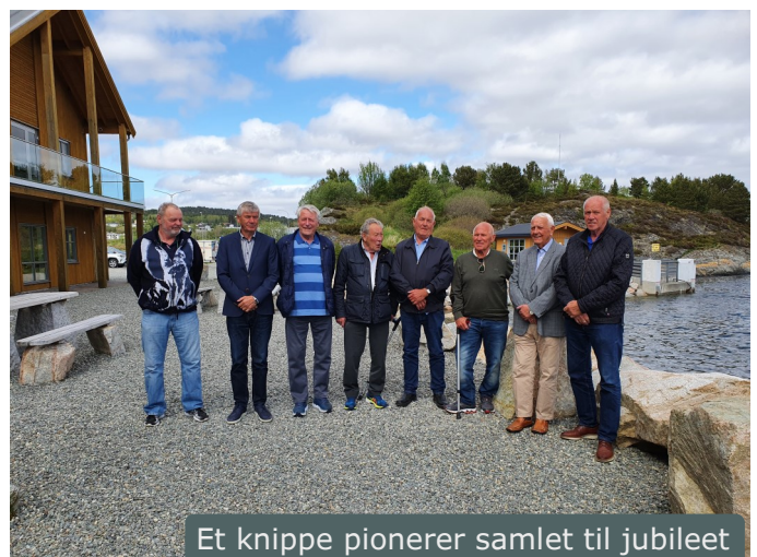
Et knippe pionerer samlet til jubileet

Det planlagte havbruksjubileet ble på grunn av pandemien flyttet til 2021. Arrangementet var en landsdekkende feiring med innslag fra flere plasser i landet. Selve hovedarrangementet var her på Hitra, med Kystmuseet tungt involvert. Museet hadde sammen med Sjømat Norge og kommunen finansiert en dokumentar om havbrukshistoria og pionererne. Filmen ble produsert av Spætt Media, med faglig støtte fra Kystmuseet. Mye av museet historiske filmaterialet kom også fra Kystmuseet. Museet bidro også med støtte under selve arrangementet.