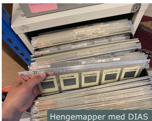
Hengemapper med DIAS

Det er gjort en stor jobb for å lette registreringsarbeidet av Vassviksamlinga i Primus. Disse ble digitalisert i 2020, men det fantes ikke et register over samlingen. Alle diasene ble nå sortert etter sted, tid, emner osv, og plassert i hengemapper merket med emne.