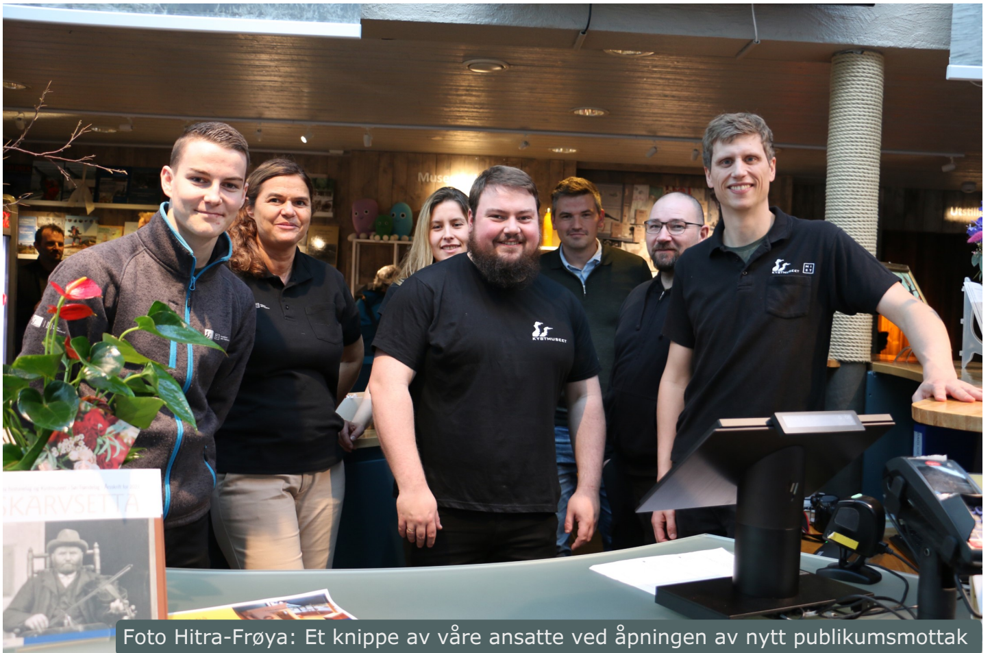
Foto Hitra-Frøya: Et knippe av våre ansatte ved åpningen av nytt publikumsmottak