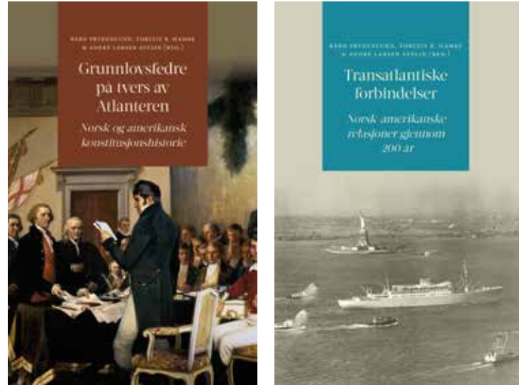
Bokforsider fra Scandinavian Academic Press / Spartacus Forlag.

Grunnlovsfedre på tvers av Atlanteren tar leseren med tilbake til revolusjonstiden og de politiske og sosiale omveltningene som fant sted flere steder i verden i tiårene rundt 1800. I denne perioden ble nettopp grunnlover et viktig redskap for statsbygging i mange land, og eidsvollsmennene er bare én av forsamlingene som i høytidelige dokumenter satte opp nye rammer for det politiske systemet og for utøvelsen av statlig makt. Karakteristisk for disse grunnlovene er at de erstatter mer autoritære styreform, som eneveldet, med politiske systemer basert på idealer om folkestyre, maktfordeling og borgerrettigheter. Blant flere nasjonale grunnlover fra revolusjonstiden, er det likevel kun to som regnes for å være gjeldende fram til i dag: den amerikanske fra 1787 og den norske fra 1814.