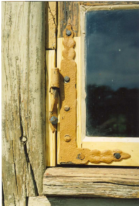
Biblioteksflygeln Östra fasaden södra fönstret. Film nr 3108