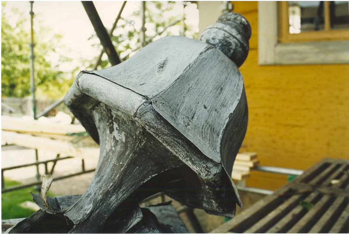
Spiran på västra paviljongens tak. Film nr. 3110.