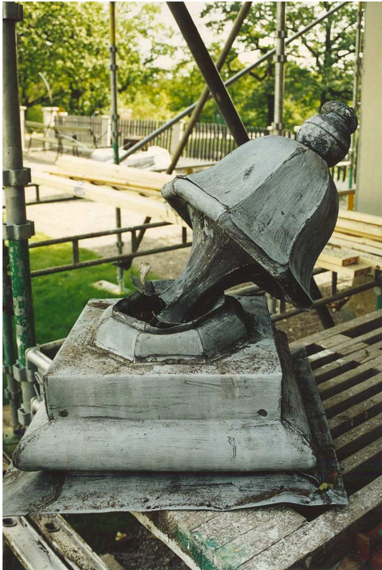
Spiran på västra paviljongens tak. Film nr. 3110