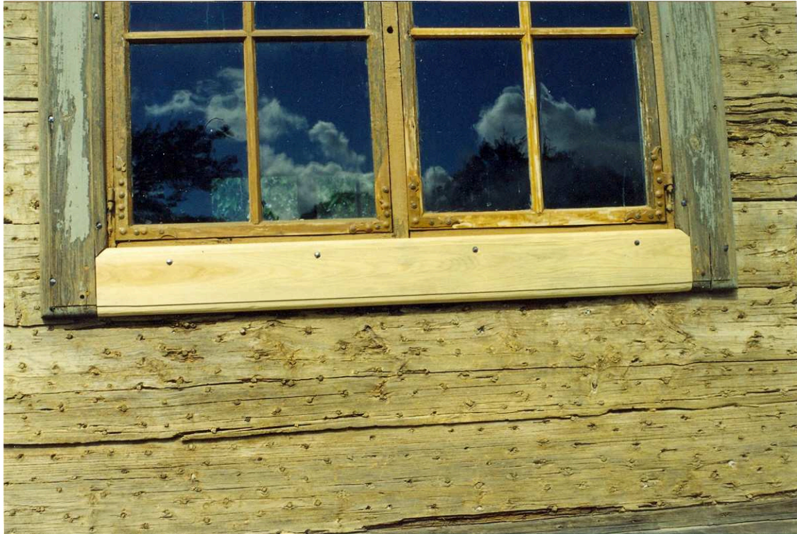
Nytt foder på fönster på Biblioteksflygeln. Film nr.3104