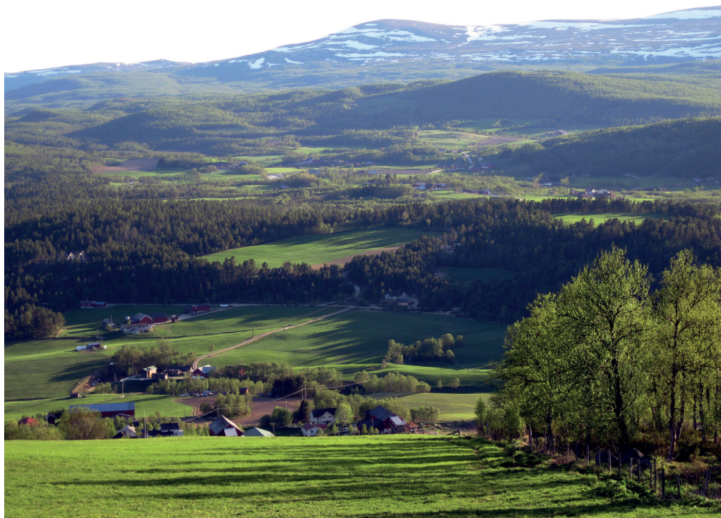
Utsyn fra Heiervangen over bygda mot Hognene i sørvest.

ubønnhørlig slutt på hustømmeret. Ser en på Røros, har avskoginga vært katastrofal. Fire hundre år har det vel stort sett tatt før furuskogen igjen begynner å slå rot. Fullt utvokst vil det til advarsel for de som gjør inngrep i naturen i Rørosdistriktet, ta minst fem hundre år før furuskogen når de gamle grensene for utbredning.