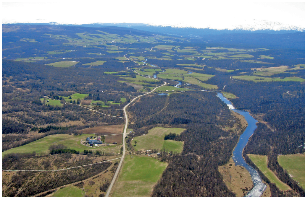
Elva Vangrøfta sett nordfra gjennom bygda og i bakkant lia med fra venstre Vangen, Breen og Østgarden.

sted det er setrer, er i Mastukåsa. Før det ble bygd seter her, var det antakeligvis reist ei slåttebu hvor slåttefolket hadde mat og rasta.