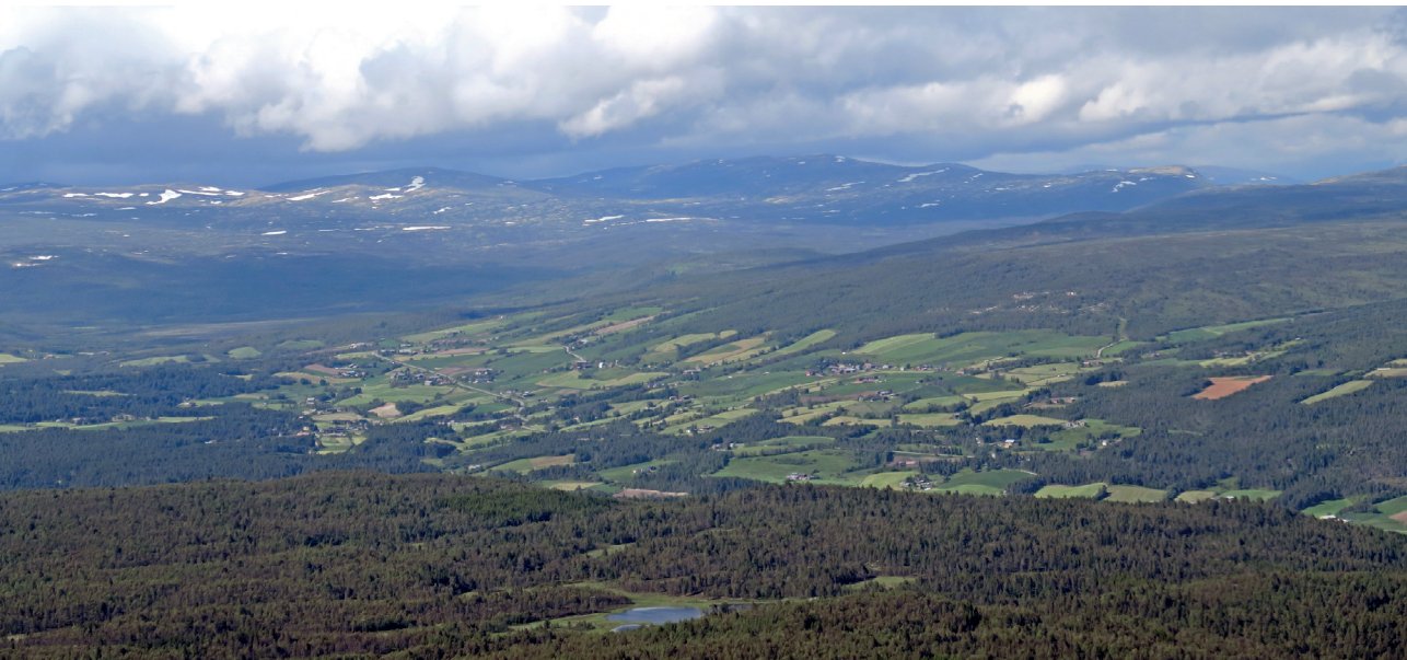
Oversiktsfoto fra sør med Østgarden og vegen til Setersjøen til høyre, Breen midt på bildet og Vangen i nord hvor Kjurudalen går inn til høyre.

Folketallet og virksomheten i Dalsbygda fortsatte og vokse ut over i middelalderen. Nye bruk ble rydda, og tilsvarende nye navn som for eksempel Haugen, Eggen og Åsen kom til. I tillegg ble opphavsgårdene delt opp, og en fikk en ny navnetype, delingsnavn. I Breen ble det Fremstu, Nordstu, Utstu og Øststu. På Berg ble det Storstu og Bortiststu. På Vangen ble det Øfstu og Utiststu. På Aker ble det også deling. Tilsvarende ble det på grunn av klimaendring