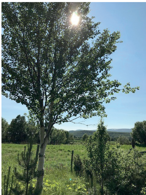
Foto fra tomta hvor pilgrimskapellet stod mot Nonsåsen tatt kl.16 sommertid.

Dalsbygda fikk imidlertid pilgrimskapell på Brattåsen rett ned for Vangen. Dette kan ha vært nytta i to til tre hundre år. Det har heller ikke unnlatt å sette navnemessig spor etter seg. Tomta hvor kapellet stod, er nå merka med ein steinstøtte. Kapellet var lite og spartansk, og det ble brukt i katolsk tid så lenge det farta pilgrimer til og fra Nidaros. I den katolske kjerka er de flinke til å holde bønnetimer. Den viktigste bønnetimen er kl. 3 om ettermiddagen da Jesus etter sagnet døde på korset. Etter den tidas tidsregning var det den niende timen. Hvis du når det ikke er sommertid, står på kjerketomta, så står sola rett over Nonsåsen kl. 3 om ettermiddagen. Nona Hora er den niende timen på latin.