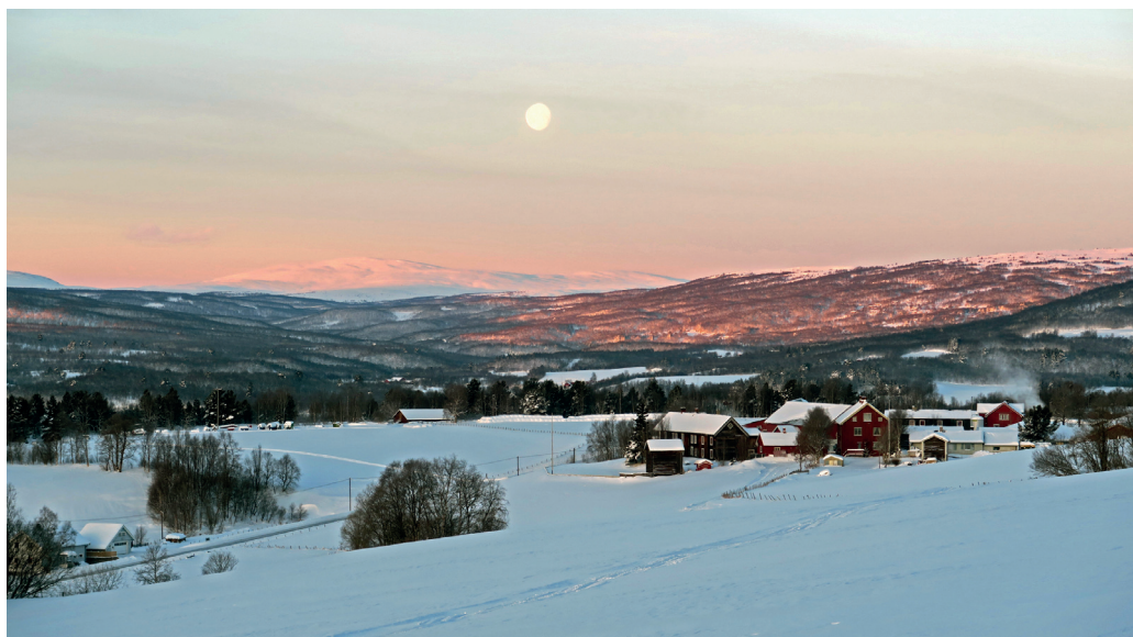
Vangrøftdalen med Tverrfjellet i bakgrunnen sett fra Breen.

seområde. Området burde ha vært et turistmål når vestsida av Åslitangen heter Vakkerlia. Navnet er imidlertid sikkert avleda av noe helt annet enn det vi leser på kart i dag.