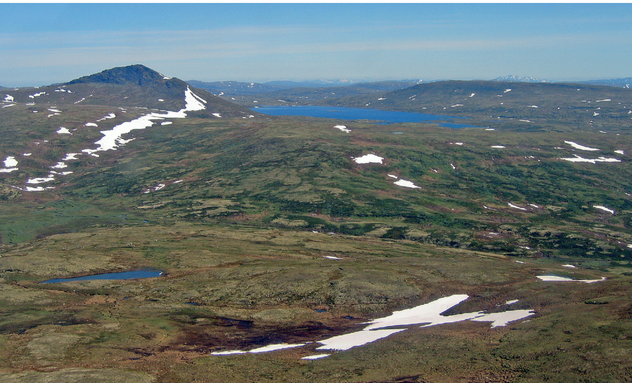
Nasjonalparkområdet med Forolshogna til venstre, Forslsjøen og Buhogna til høyre.

Gardåhøgda høyest. Kommer en vestfra, må en over de majestetiske Langfjellshog-nene. I sør ruver Håmålsfjellet og enda lenger sør i synsranda Tronfjell. Alt dette er sikre vegmerker som har vært til siden menneskene først farta gjennom området. Navnene på Gaula og Glåma har vært der før noen kom så langt som til Dalsbygda. Snudda og Vangrøftdalen med Vangrøfta langs vegen nordfra er helt sikkert også navnsatt av de første vegfarende. Det samme gjelder Kjurua og Kjurudalen. Tilsvarende blir det etter hvert med Langen og Langsåa langs ferdseksen fra Vingelen. Her er det kommet et nyere ferdnavn, Milskiftet. Berg er sikkert også navngitt av ferdafolk. Breen og Vangen er nevnt tidligere.