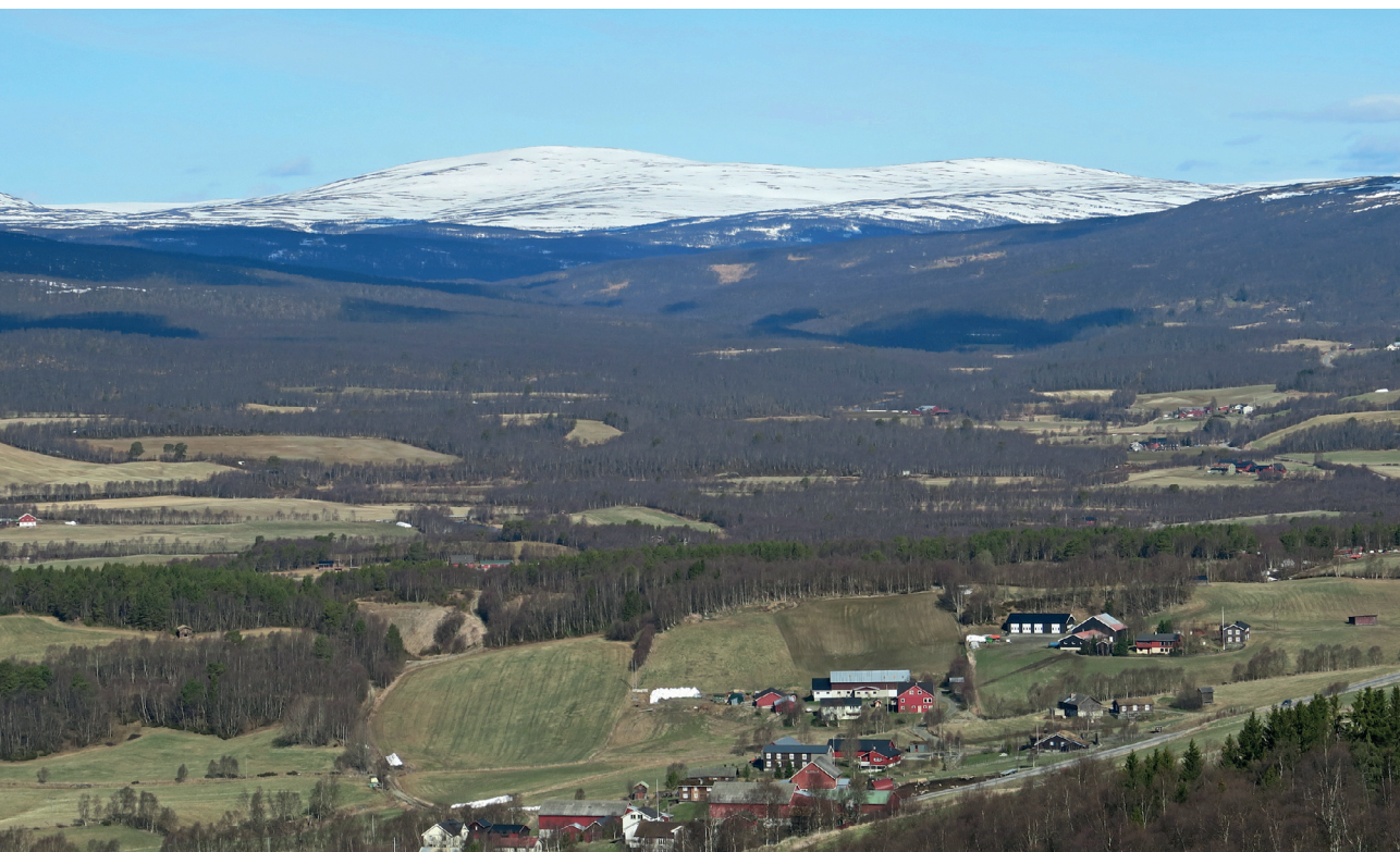
Vangrøftdalen med Tverrfjellet i bakgrunnen sett fra Breen.