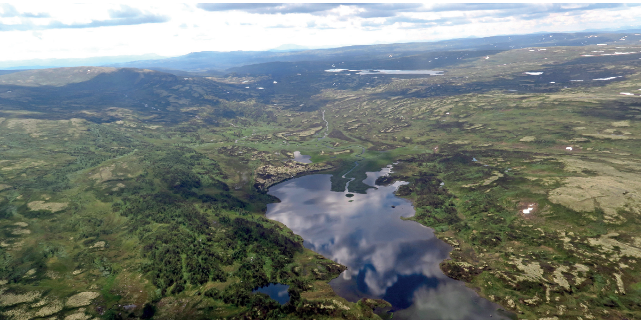
Dalbusjøen sett nordfra med Fjellsjøen og Fjellsjøbekken i bakgrunnen og Dalbuvollen på sletta til venstre der bekken munner ut i Dalbusjøen.

dalsbygdvannet med Forda ned til Gauldalen og videre ut i Gaulosen ved Trondheimsfjorden.